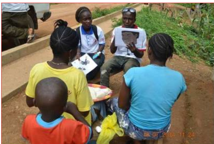
Sensibilización realizada por la Cruz Roja de Sierra Leona