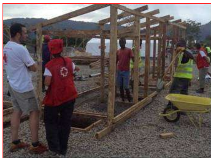
Levantamiento del Centro de Tratamiento de Ébola de Cruz Roja