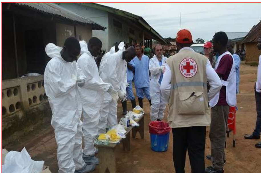
Con el equipo de protección personal

Hasta la fecha, la FICR ha lanzado llamamientos de emergencia para: Liberia, Guinea Conakry, Sierra Leona y Nigeria; también ha destinado DREFs a países donde se prevé que la enfermedad se pueda extender como: Costa de Marfil, Mali, Senegal, Benin Togo y Camerún. En los últimos días, se ha aumentado el volumen de los llamamientos de Liberia, Guinea y Sierra Leona para poder responder de manera más amplia a la epidemia. Las cuatro peticiones suman, hasta el momento, más de 26 millones de euros.