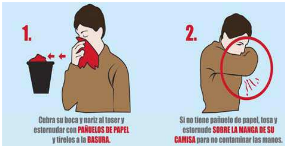
Figura 2.- Método de higiene respiratoria