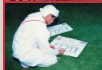
Media Luna Roja de E.A.U.