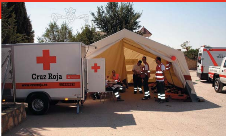
ERIE de Avituallamiento utilizada en emergencias.