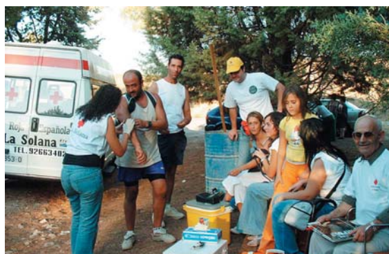
Cruz Roja atiende a los participantes en la romería.

La Asamblea Local de Cruz Roja en La Solana (Ciudad Real) prestó servicios preventivos en la Romería de la Patrona del pueblo Virgen de Peñarroya celebrada durante los días 9, 10 y 11 de septiembre en el denominado Castillo de Peñarroya. Con este preventivo se presta apoyo a las personas que se desplazan andando y a todas las que participan en esta Romería y necesitan atención de primeros auxilios. En el preventivo participaron voluntarios de La Solana, Villanueva de los Infantes y Manzanares.