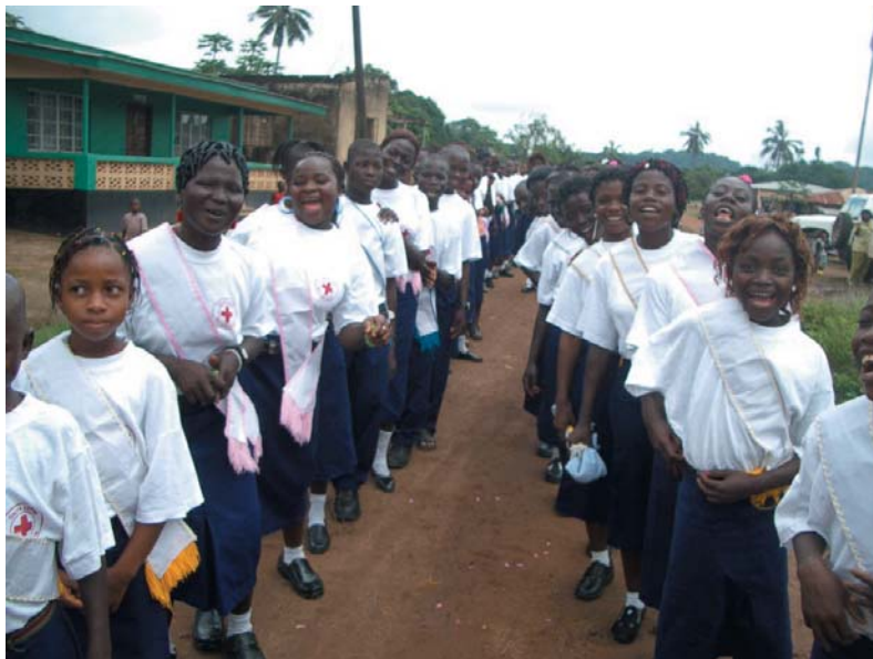
Grupo de menores participantes en el proyecto.

Los niños participantes reciben formación en agricultura,