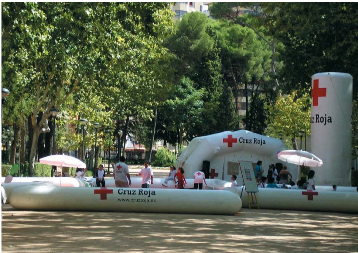
La Cruz Hinchable fue un éxito de público.