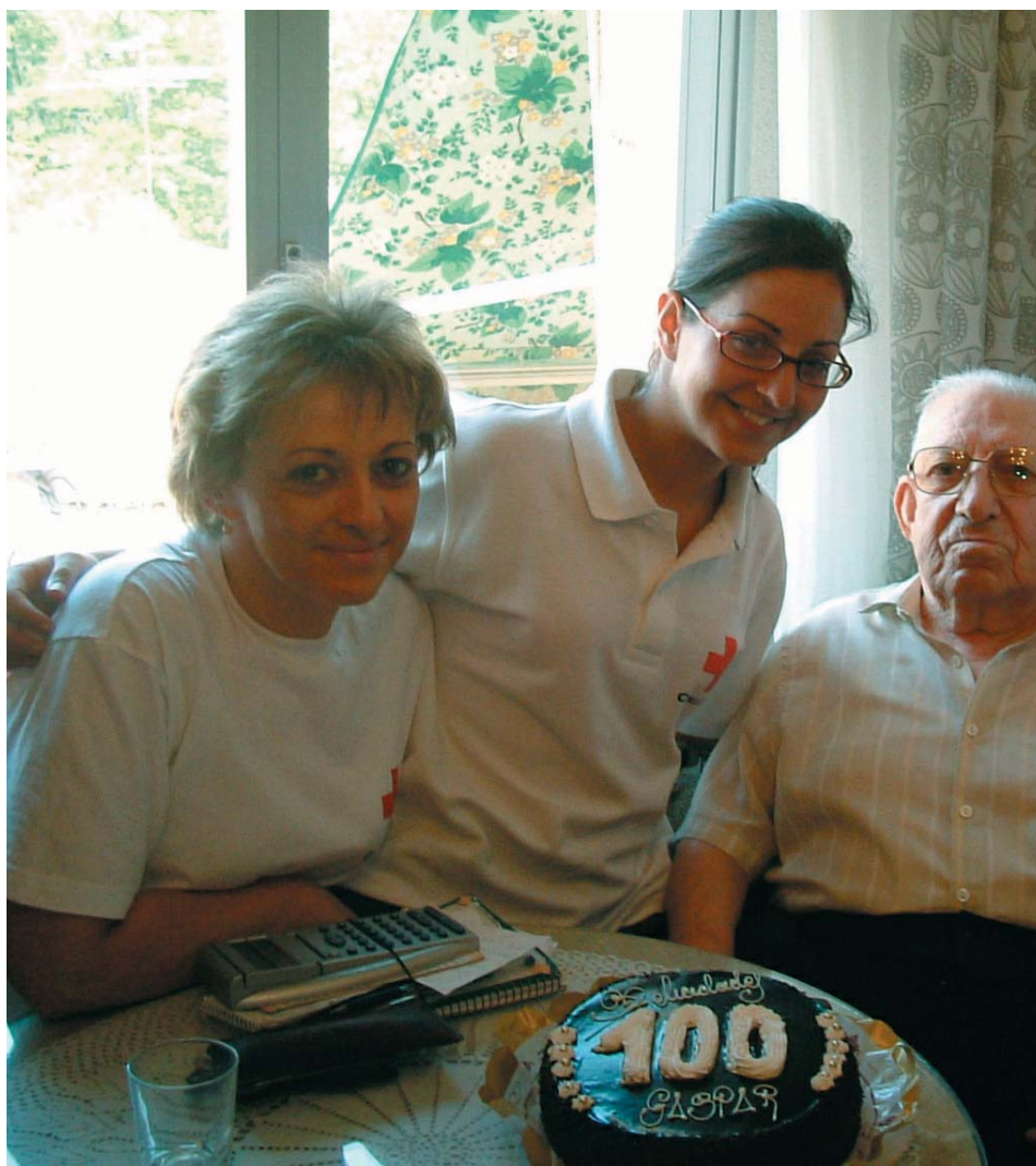
Voluntarios con el usuario agasajado celebrando el cumpleaños.

El día anterior había celebrado esta fecha tan señalada con toda su familia y mostraba todo orgulloso los regalos y tarjetas