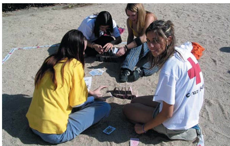
Jóvenes de los clubes Sede en su II Encuentro Provincial.

Estos trabajos se incluirán finalmente en la guía. Este proyecto cuenta con la financiación de la Junta de Comunidades de Castilla-La Mancha.