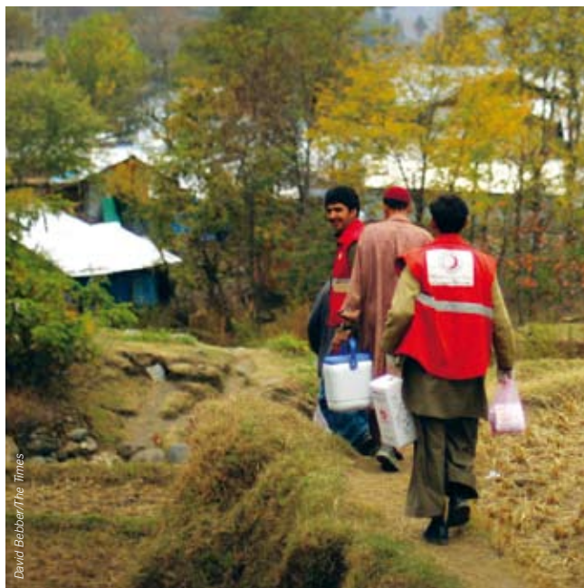
David Bebban/The Times

individuos como de las comunidades. El aumento de la esperanza de vida, la evolución de los índices de natalidad y las persistentes desigualdades de género, unidos a las tendencias en los comportamientos sociales, económicos y personales, han contribuido a cambiar significativamente los patrones de enfermedad. En general, está aumentando la importancia de ciertas enfermedades no transmisibles. Se prevé que en 2020 las principales causas de muerte, enfermedad y discapacidad a nivel mundial serán las enfermedades cardíacas y los derrames cerebrales, la depresión, los accidentes de tráfico, los traumatismos relacionados con la violencia y los conflictos, y las afecciones respiratorias, junto con las complicaciones perinatales y maternas, la tuberculosis, el VIH y las enfermedades diarreicas. El paludismo y otras enfermedades transmisibles disminuirán, aunque seguirán siendo significativas en los países de bajos ingresos. Además, seguirán apareciendo