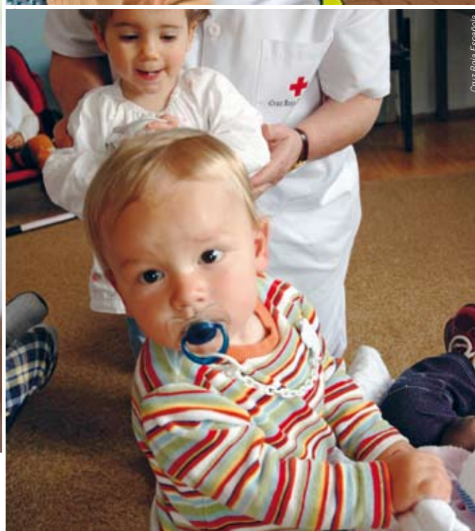
Cruz Roja Española

tensiones de manera pacífica. Hacemos frente activamente al prejuicio social y alentamos la tolerancia y el respeto de las muchas perspectivas diferentes que cabe esperar en un mundo diverso. Ello incluye emprender iniciativas de sensibilización en favor de la adopción de enfoques no violentos para salvar estas diferencias y anticipar la aparición de conflictos violentos.