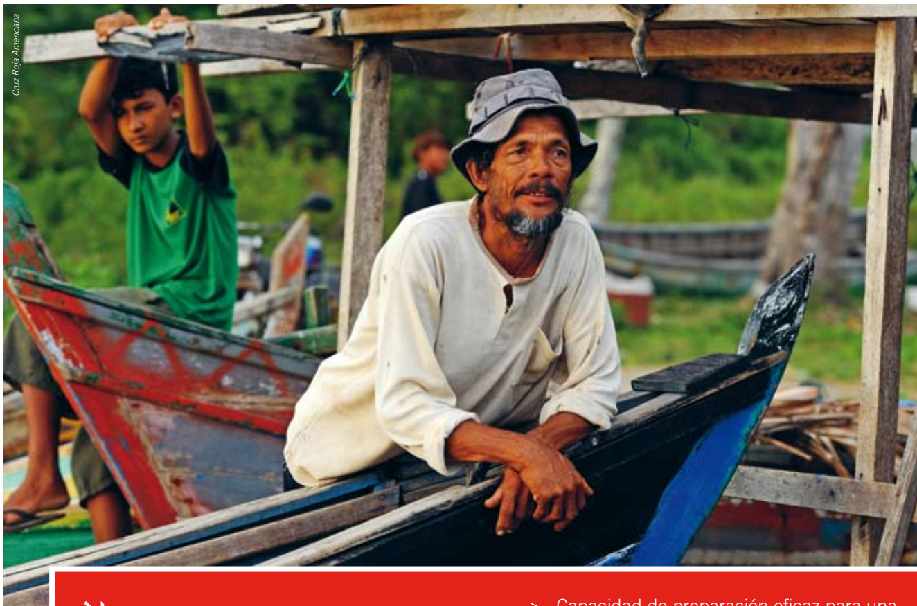
Cruz Roja Americana

la capacidad de respuesta en casos de emergencia. En virtud de los Estatutos, la secretaría tiene la obligación de “organizar, coordinar y dirigir las acciones internacionales de socorro” entre los servicios básicos que presta a los miembros de la Federación Internacional. Aprovechando las capacidades complementarias de las Sociedades Nacionales, aseguramos que en todo momento estén disponibles instrumentos eficaces y capacidades de acción fiables, a través de un enfoque sin fisuras que conecta los planos mundial, regional, nacional y local. Esto nos da la confianza necesaria para enfrentar el aumento probable de la cantidad y la magnitud de los desastres de gran envergadura en todo el mundo. La Federación Internacional y el CICR cooperan de manera coordinada para mantener capacidades sustanciales para brindar protección y asistencia a las personas afectadas por conflictos armados y violencia.