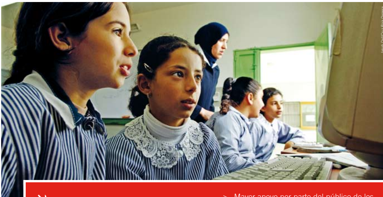
Jakko Dall/Cruz Roja Danesa

del público. Esto comprende promover el respeto de los convenios de derechos humanos específicos para personas desfavorecidas, y facilitar su acceso a servicios más abiertos y más adaptables de salud y seguridad social.