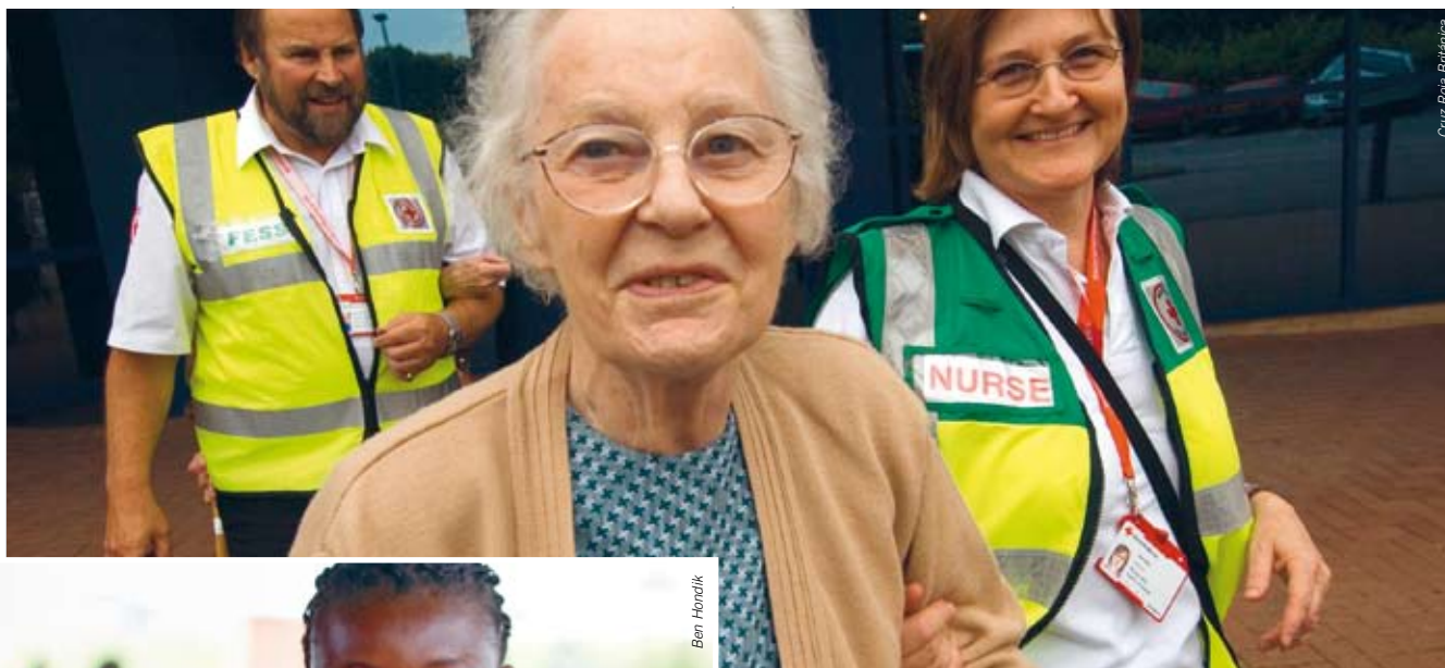
Cruz Roja Británica