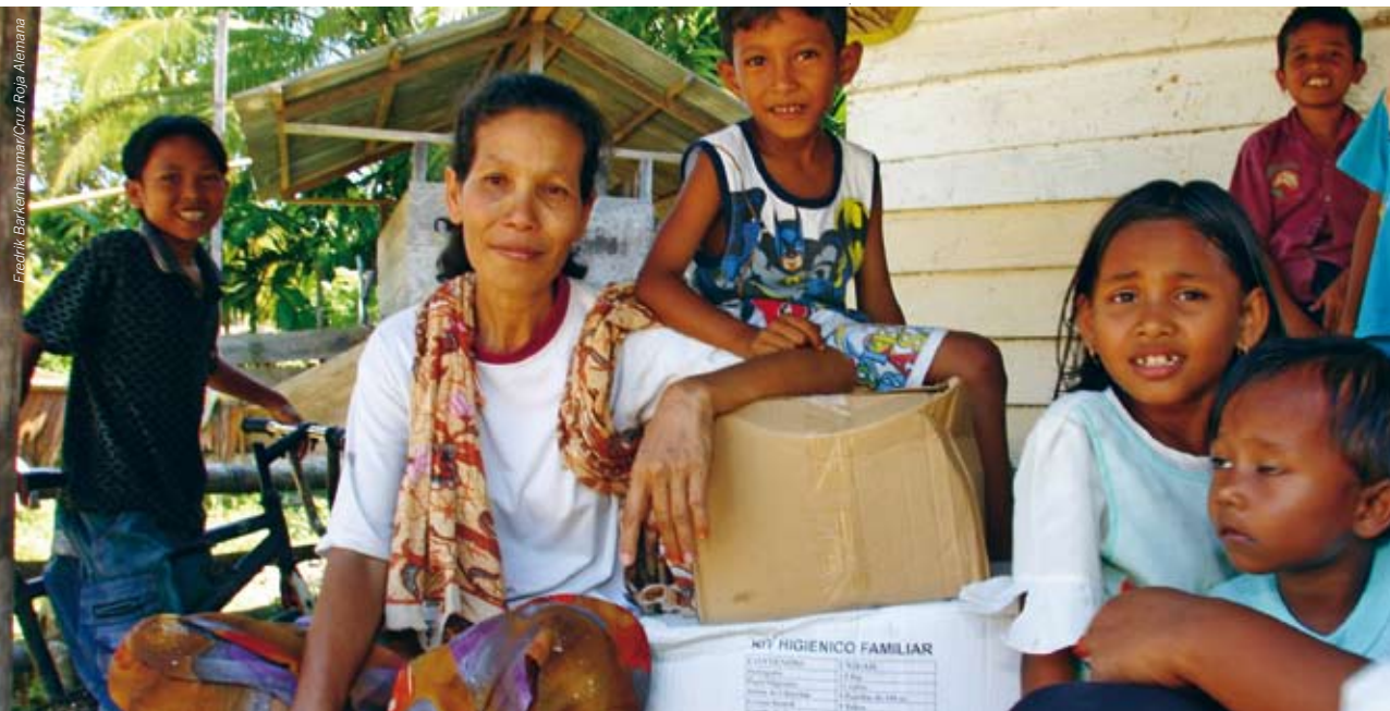
Friedrich Barthelmann/Cruz Roja Alemana

Las Sociedades Nacionales procuran alcanzar la excelencia en lo que hacen y están empeñadas en crecer de manera sostenible, porque desean hacer más por las personas vulnerables. Las Sociedades Nacionales definen las características esenciales que las hacen efi-