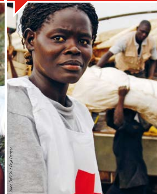
Jakob Dall/Cruz Roja Danesa

Página 22 Acción facilitadora 1 Construir Sociedades Nacionales de la Cruz Roja y de la Media Luna Roja fuertes