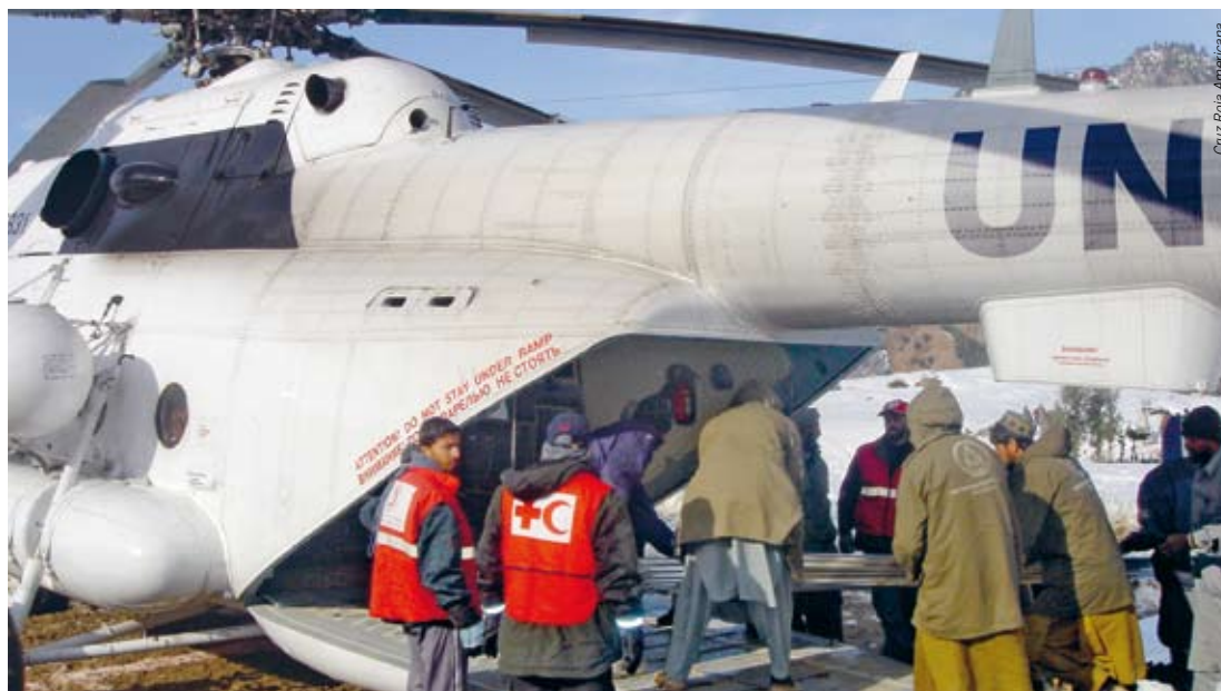
Cruz Roja Americana