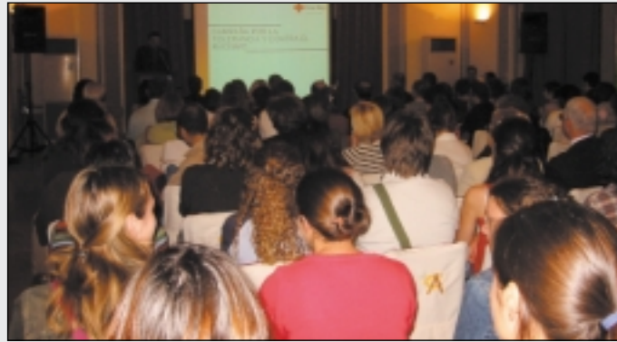
Momento de presentación de la campaña, con la sala abarrotada de público.

bajadores, asociaciones, medios de comunicación, ciudadanos en ge-