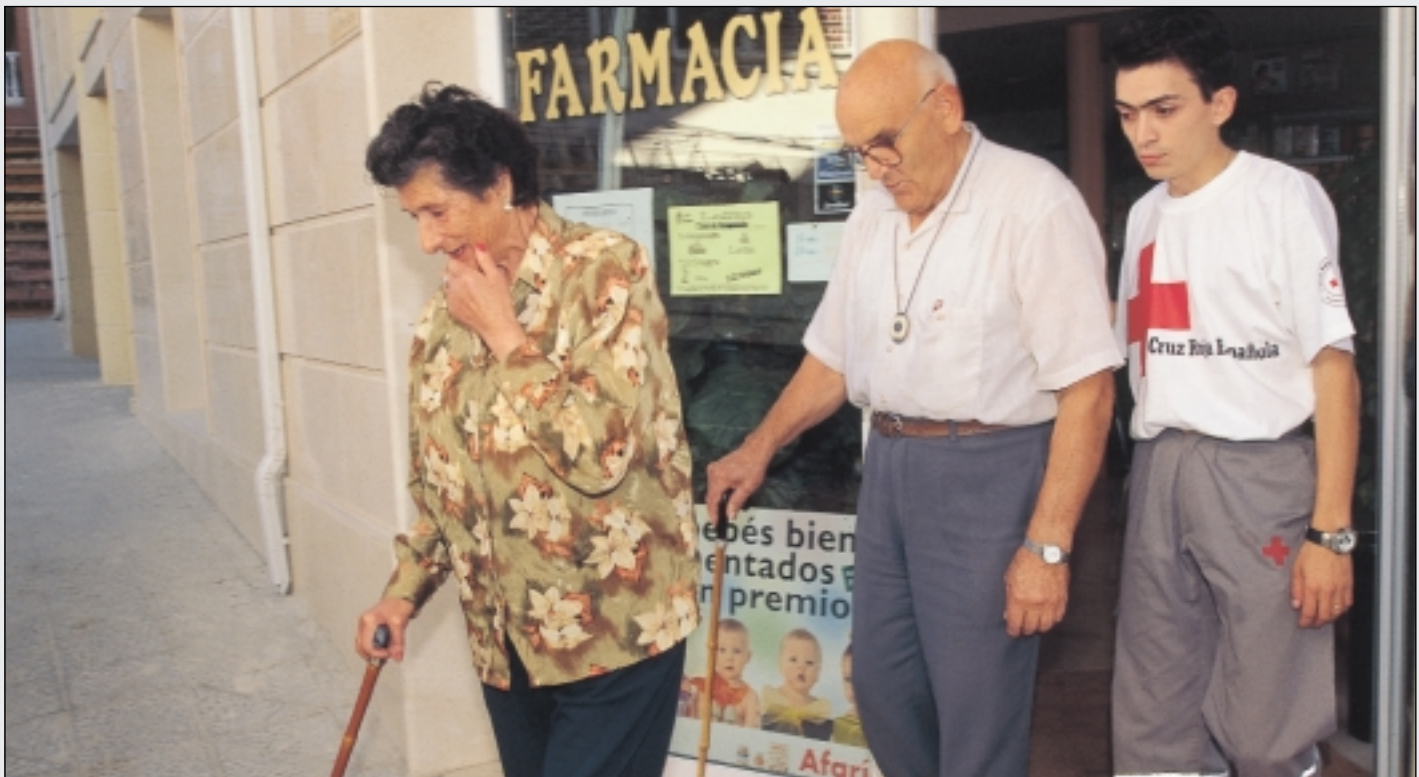
El trabajo con colectivos vulnerables, uno de las posibilidades que ofrece el voluntariado en el entorno local.

Generar un espacio para la formación y participación de los voluntarios con responsabilidades en el ámbito local de la provincia de Alicante fue el principal objetivo de la Escuela de Voluntariado celebrada el pasado mes de noviembre en el Albergue Virgen de las Virtudes de Villena.