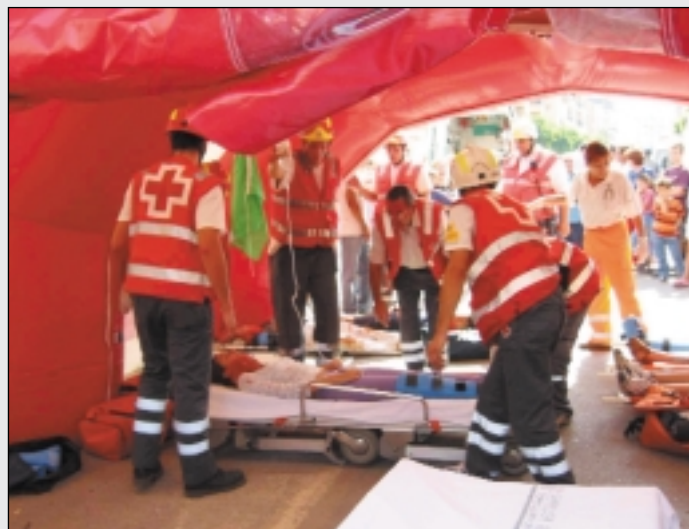
Momento del simulacro con la intervención de 21 voluntarios en Nules.