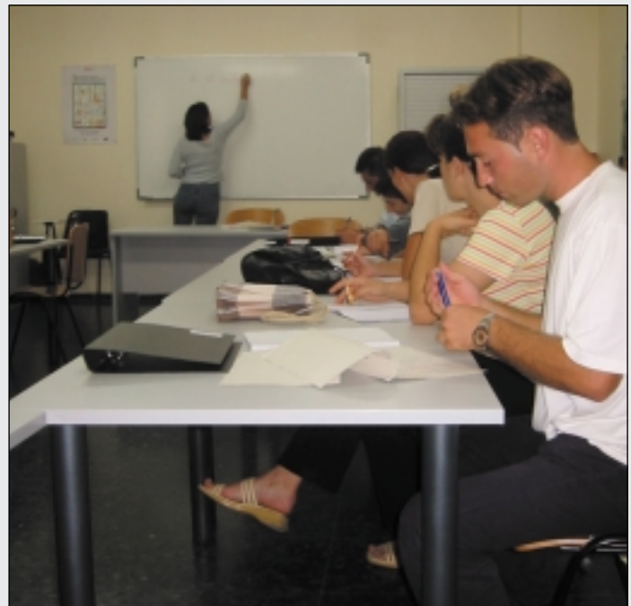
Adquirir soltura en el desempeño de un puesto de trabajo, principal motivo para aprender castellano.

castellano proceden mayoritariamente de Rumanía, el Magreb (Marruecos y Argelia principalmente), seguidos de África Subsahariana y otros países del Este. En Cruz Roja conviven neolectores, incluso analfabetos, con licenciados en medicina, ingenieros, psicólogos, arquitectos, etc. En Cruz Roja se les asesora sobre la situación laboral, escolar, si tienen hijos, la asistencia sanitaria ante problemas de salud, etcétera. Aquí se pretende ofrecer una atención integral para una integración real. Y el idioma es fundamental para alcanzar nuestro objetivo.