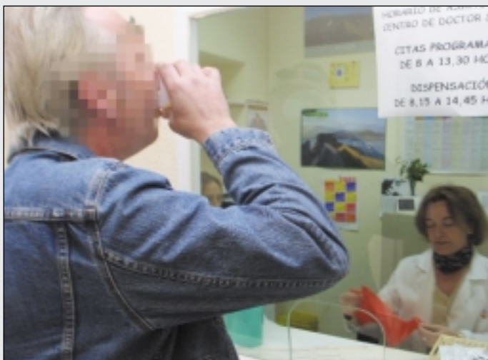
Un beneficiario ingiere una dosis de metadona. La foto corresponde a un centro de dispensación de Cruz Roja en Madrid.

Los voluntarios de las sedes de Oliva y Alaquàs, celebraron en septiembre el Día Europeo de los Primeros Auxilios. Puesto que los accidentes de carretera provocan cerca de un millón de muertes y más de diez millones de heridos cada año, las actividades que se realizaron en cada Asamblea sirvieron para recalcar la importancia de la formación en los primeros auxilios, necesarios para salvar vidas. Algunas de las diversas actividades que se realizaron fueron los simulacros de accidentes, las prácticas de vendajes, inmovilizaciones y reanimaciones cardiopulmonares. También se dispuso de un stand informativo en Oliva y una mañana de puertas abiertas en Alaquàs. Para apoyar esta iniciativa, la Cruz Roja y la Unión Europea han desarrollado la campaña "Sólo tienes una vida... ¡Cuidala!". Paula Muñoz.