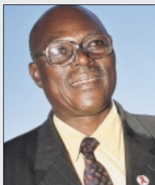
El presidente de la Cruz Roja de la República Democrática del Congo, Mathie Kalompbo, que visitó recientemente nuestra Comunidad.

Según el Informe del Programa de Naciones Unidas para el Desarrollo, la RDC es uno de los 20 países más pobres del mundo, ya que ocupa el puesto 155 de 174 en el índice de desarrollo humano. Estas cifras significan, por ejemplo, que