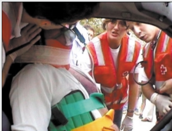
Simulacro de accidente en carretera organizado en Alaquàs.

Una exposición con las actuaciones más destacadas, un simulacro a cargo de los voluntarios de socorros y emergencias; seguido de una recepción en el salón de plenos y una cena baile, fueron las actividades más destacadas de una jornada digna de recordar para todos. Celia Prats.