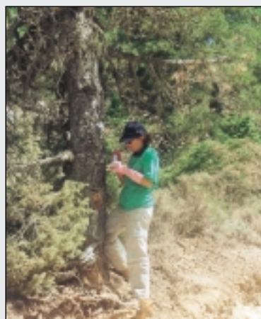
Una voluntaria rotula una de las rutas.

Se establecieron puntos fijos y móviles de información durante todo el día en aquellos puntos de máxima afluencia de visitantes para explicar las cuestiones relativas a la conservación del medioambiente e información turística.