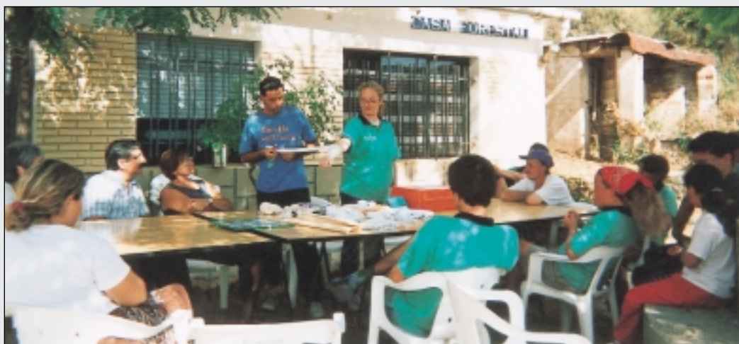
Taller de primeros auxilios con vecinos del Rincón de Ademuz

En dos turnos de seis horas cada día se establecieron rutas en vehículos 4x4, en bici y a pie para aquellas zonas de difícil acceso. Durante estas vigilancias, los voluntarios registraron incidencias sobre vertidos ilegales, control de paso de vehículos y ocupación de zonas de acampada. Toda esta información fue facilitada a la Consellería de Medio Ambiente y a los agentes locales, que estuvieron coordinados con Cruz Roja para la ejecución de este programa.