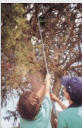
Colocación de un nido.