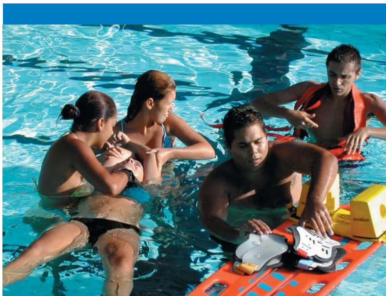
Momento de uno de los cursos de socorrismo acuático.

Además de la asistencia sanitaria, CR llevó a cabo otras acciones de tipo social en las playas de la provincia, destacando la atención a niños extraviados y la ayuda a los discapacitados. Tampoco hay que olvidar la campaña de CR "Este verano quírete mucho" y de la que se beneficiaron unas 2.000 personas.