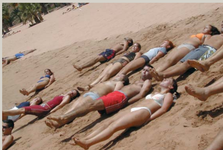
Los cursos están reconocidos por la Escuela de Servicios Sanitarios y Sociales de Canarias.

Para más información en el departamento de Formación 928 290 000, extensión 1475/78 o a través del Email: formación35@cruzroja.es