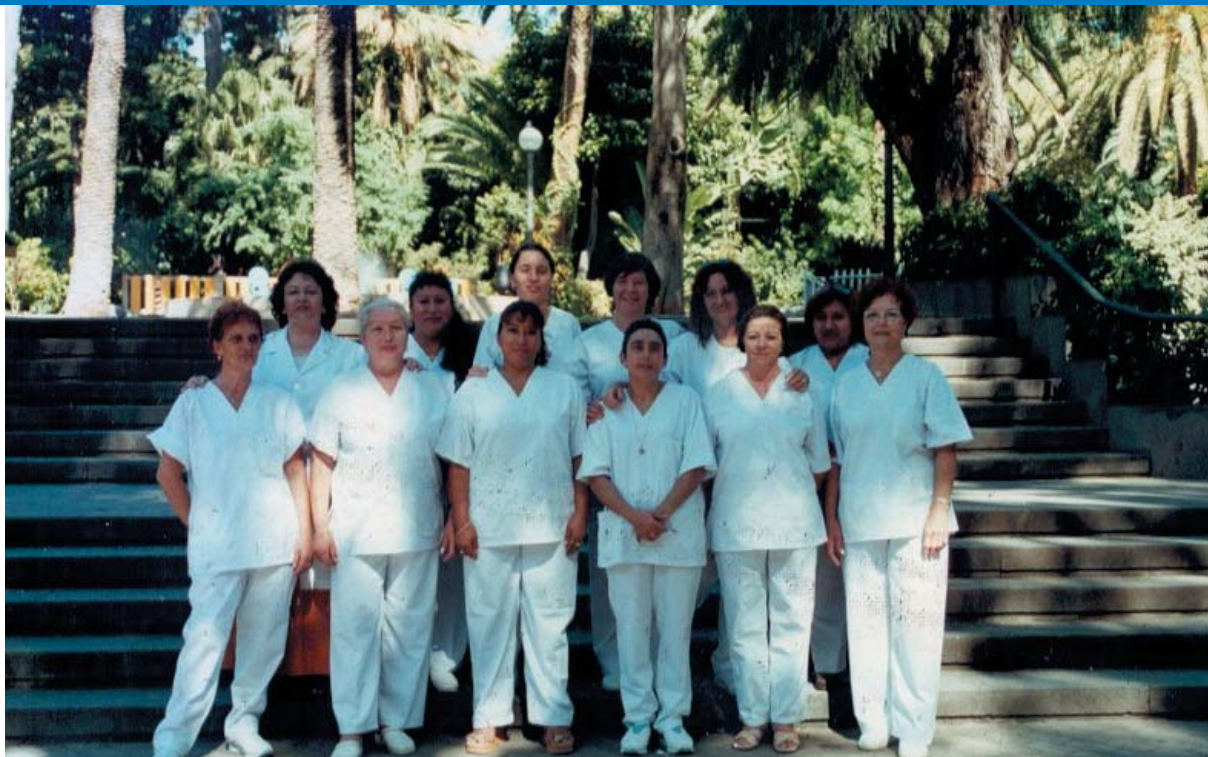
Asistentes al curso del servicio de ayuda a domicilio de Cruz Roja en Tenerife.