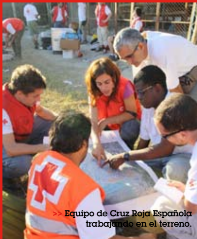
>> Equipo de Cruz Roja Española trabajando en el terreno.

Desde Cruz Roja en Cantabria queremos dar las gracias a todos aquellos que habéis colaborado en posibilitar el envío de ayuda a Haití tras el terremoto sufrido el pasado mes de enero. Gracias a vuestra colaboración, Cruz Roja Española cuenta con varios delegados para responder a la operación de ayuda humanitaria. Cruz Roja Española va a seguir con sus actividades de emergencia a la vez que está identificando proyectos más a largo plazo, centrados en agua y saneamiento, desarrollo económico, rehabilitación de infraestructuras sociales (escuelas y centros de salud), alojamiento temporal y el fortalecimiento de la Cruz Roja Haitiana. Para colaborar en el envío de ayuda humanitaria puede llamar al teléfono de Cruz Roja 902 22 22 92.