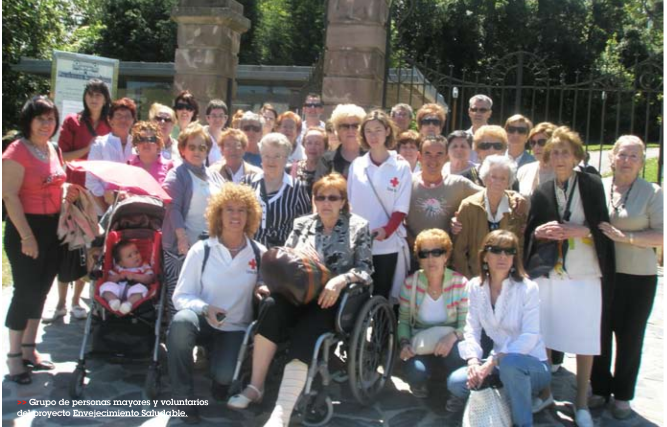
>> Grupo de personas mayores y voluntarios del proyecto Envejecimiento Saludable.