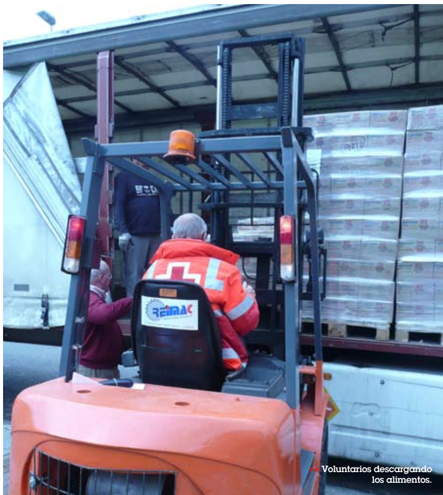
Voluntarios descargando los alimentos.

Cruz Roja adquirió el aceite con fondos procedentes de donativos y socios.