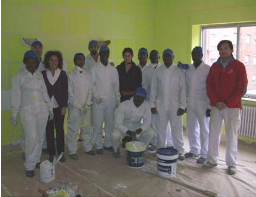
>> Participantes y técnicos del curso de pintar.