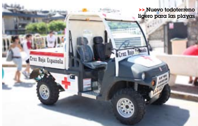
>> Nuevo todoterreno ligero para las playas

diseñado y adaptado para operar en playas. Este vehículo, financiado con fondos propios de Cruz Roja, permitirá trasladar heridos de la playa al puesto de Primeros Auxilios o a la base de Salvamento.