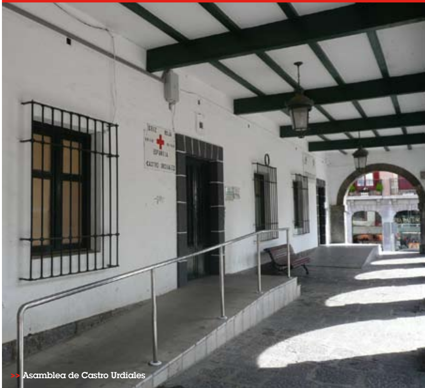
>> Asambleas de Castro Urdiales