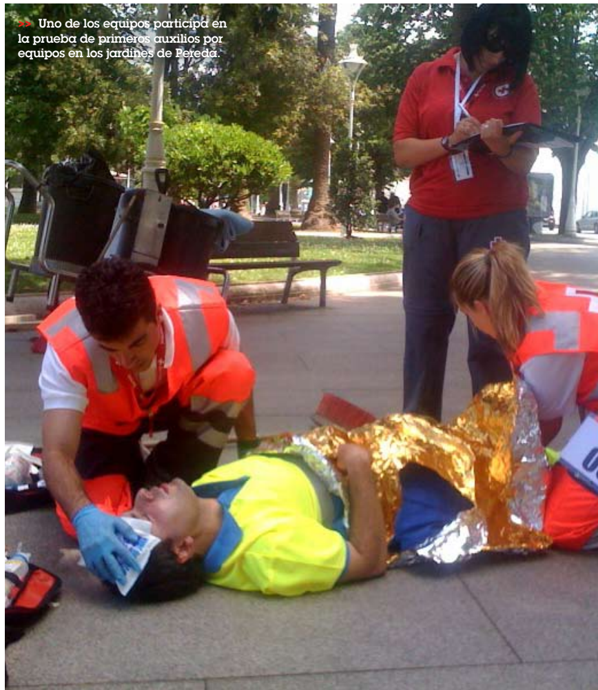
>> Uno de los equipos participa en la prueba de primeros auxilios por equipos en los jardines de Pereda.