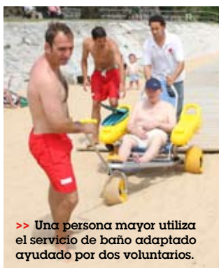
>> Una persona mayor utiliza el servicio de baño adaptado ayudado por dos voluntarios.

Un total de 175 personas utilizaron este servicio con la ayuda de voluntarios y socorristas de Cruz Roja. La actividad fue posible también gracias a varios vehículos adaptados y al puesto adaptado con sillas anfibas que el Ayuntamiento de Santander tiene ubicado en la playa de Los Peligros, en Santander.