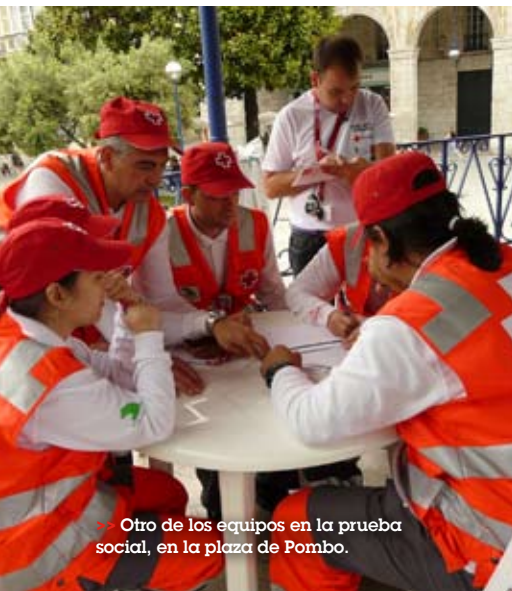
>> Otro de los equipos en la prueba social, en la plaza de Pombo.