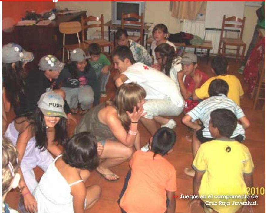
2010 >> Juegos en el campamento de Cruz Roja Juventud.

El campamento se planteó para ser, además, un apoyo para que las familias pudieran conciliar vida laboral y familiar.