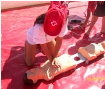
>> Una de las niñas del campamento participa en un taller de primeros auxilios realizado en la playa de El Sardinero.