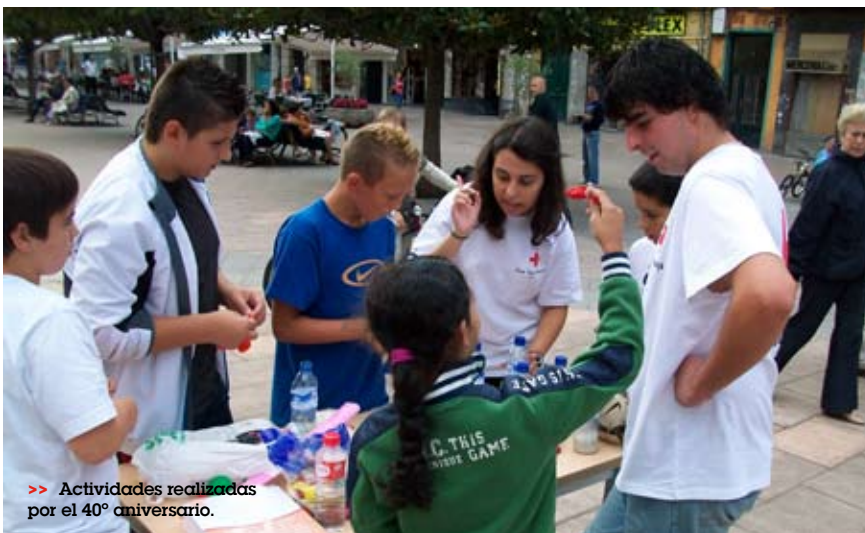
>> Actividades realizadas por el 40º aniversario.

El personal voluntario celebró el aniversario con diferentes talleres y actividades en las calles de Santander.