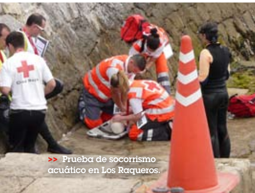
>> Prueba de socorrismo acuático en Los Raqueros.