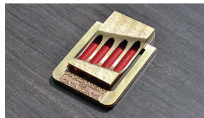
▶ Medalla d'Honor en la categoria d'Or del Parlament de Catalunya.

La Creu Roja, en coordinació amb els altres cossos d'emergència i seguretat, va activar els Equips de Resposta Immediata en Emergències (ERIE) d'Intervenció Psicosocial, vehicles de coordinació, transport, aviuallament, logístic, d'intervenció sociosanitària. Es van cobrir 919 places d'acció voluntà-