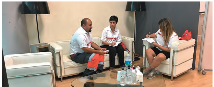
▶ Integrants de l'ERIE Psicossocial que va donar suport als familiars de les víctimes.

Des del primer moment, la intervenció a la Rambla i a la Plaça de Catalunya es va centrar en els tractaments que no requereixen atenció hospitalària. A les 17:30h es va activar el dispositiu a l'Hotel Avenida Palace per atendre els familiars de les persones afectades i totes aquelles que es trobaven al