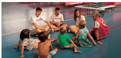
► Infants rebent suport de la Creu Roja al pavelló de Santa Maria d'Oló (Moianès).

L'incendi d'Artés (Bages) va ser un dels més destacats d'aquest estiu i va arribar a cremar 350 hectàrees a causa de condicions adverses com la calor intensa, les baixes humitats, i la vegetació seca.