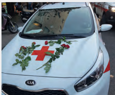
► Mostres d'agraïment de la ciutadania per la tasca realitzada per la Creu Roja.

Pare del nen de 3 anys de Rubí, víctima mortal de l'atropellament a la Rambla.