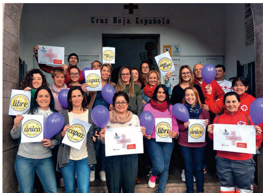
► Cruz Roja se suma al Día Internacional de las Mujeres en defensa de la igualdad de género.

Por otro lado, la violencia de género es la manifestación más brutal de la desigualdad de género. En respuesta a esta problemática, Cruz Roja presta también el Servicio de Atención y Protección a Víctimas de Violencia de Género (ATENPRO) ,