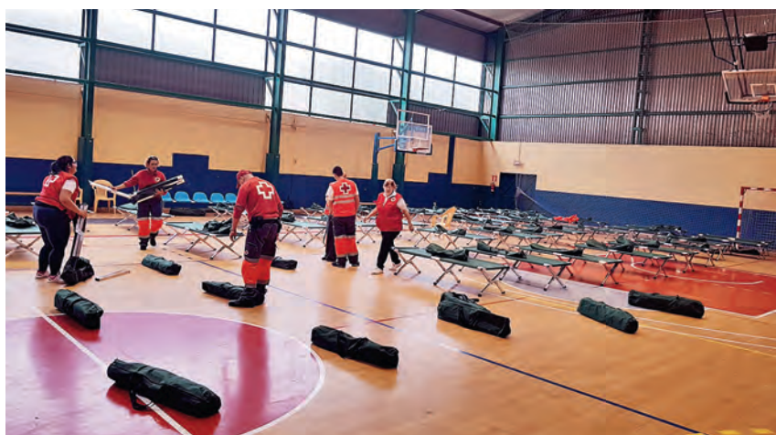
► Voluntariado realizando las tareas del montaje del albergue provisional en el Pabellón Deportivo IES Arguineguín, en el municipio de Mogán.

A principios de diciembre de 2017 un total de 150 personas voluntarias de los Equipos de Respuesta Inmediata en Emergencias (ERIE) de Cruz Roja en Canarias se dieron cita en San Bartolomé de Tirajana para compartir experiencias y líneas de trabajo.