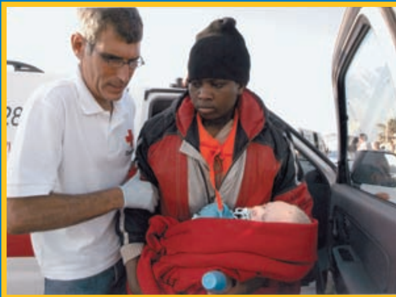
Un voluntario del ERIE acompaña a un inmigrante recién llegado y al bebé que ha traído en un cayuco.