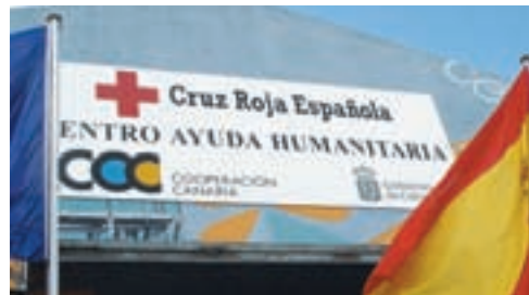
Los presidentes de ambas instituciones en la firma del convenio de colaboración. Derecha, la fachada del Centro de Ayuda Humanitaria.