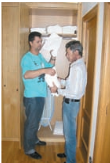
Uno de los acompañantes y uno de los pacientes de Fuerteventura y Lanzarote respectivamente. Compartir piso significa entablar relaciones personales.

El pasado 16 de octubre se inauguraron los pisos de Gran Canaria que, gestionados y coordinados por Cruz Roja Española, estarán a disposición de aquellos pacientes derivados del Servicio Canario de Salud (SCS) que necesiten alojamiento en los casos en los que tengan que pernoctar fuera de su isla de origen.