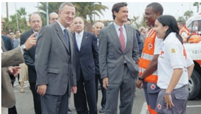
Los Ministros pudieron departir con el voluntariado mientras observaban los equipos de rescate y emergencias de CRE en Canarias.