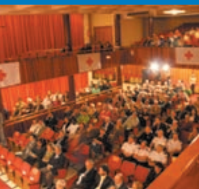
Vista del salón donde se celebró el acto de reconocimiento al voluntariado.

La realización de la actividad constituyó un espacio de encuentro, relación, intercambio, debate y formación en el ámbito de la interculturalidad y la diversidad. Dichos encuentros constituyen una herramienta útil de cara a la expansión y mejora cotidiana de Cruz Roja Juventud en la Provincia.