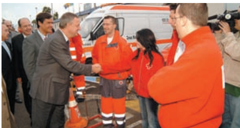
El ministro de Trabajo, Jesús Caldera, saludó al voluntariado canario en su visita a las Islas. Tras él, el Ministro de Justicia, Juan Fernando López Aguilar, y el presidente de Cruz Roja Española, Juan Manuel Suárez del Toro.