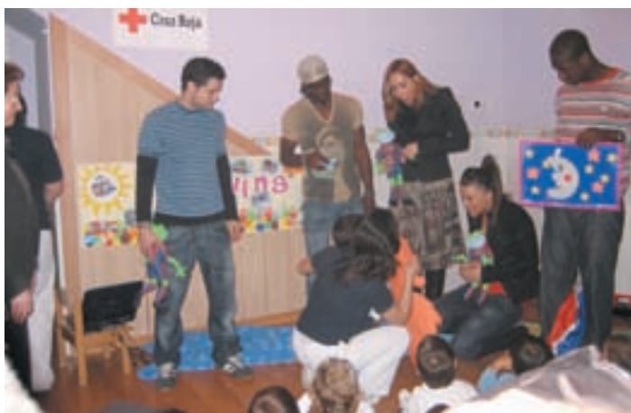
Acto de presentación de la guardería de Burkina Faso en Valencia.

Roja Juventud organizaron un taller de marionetas para sensibilizar a los menores de Redolins en la ayuda a los más desfavorecidos. La construcción de la guardería de Bogodogo está ya concluida y en septiembre está previsto el inicio del curso escolar para 100 niños y niñas del país subsahariano. El proyecto ha sido posible gracias a la aportación económica de Don Almohadón. Está prevista la visita del proyecto por parte de los responsables de Don Almohadón y Cruz Roja.