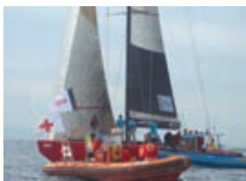
Despliegue humano y de recursos en torno al Port America's Cup.

Cruz Roja participa en todas las actividades programadas a lo largo de 2007 con motivo de la Copa América. Cada día participan 3 coordinadores, 2 operadores de comunicaciones, 3 conductores, 5 médicos, 8 DUE, 7 patronos de embarcación, 6 navegantes- socorristas y 10 socorristas acuáticos.