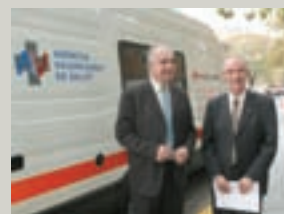
El conseller de Sanitat y el presidente de Cruz Roja presentan los vehículos.

Los dos metabuses constan de espacios para la dispensación de metadona, para la recogida de muestras, y de aseos interiores y exteriores. El objetivo de estos recursos es permitir el acceso al programa de metadona a la población dependiente de opiáceos y acercar la administración del tratamiento a pacientes que no acuden a la UCA o que tienen baja adherencia al tratamiento. Cruz Roja atiende diariamente a un total de 4.431 pacientes con drogodependencia en la Comunidad Valenciana.