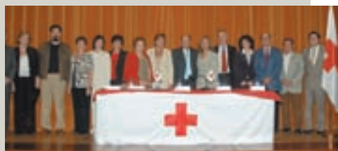
Momento del reconocimiento a los fundadores en su 25 aniversario.

Los voluntarios y voluntarias de Cruz Roja en Aldaia están de enhorabuena, ya que a lo largo del 2007 celebrarán el 25 Aniversario de la Asamblea con un completo programa de actividades. Cada dos meses hay una exposición fotográfica distinta de Cruz Roja en Aldaia (Camino de Esperanza, 8 Objetivos del Milenio, Tsunami en el Sur de Asia, Derechos Humanos y DIH, Grandes Lagos, Mujeres y Guerra). También se prevé un gran simulacro de emergencias en octubre, numerosos cursos de formación, y una cena de gala para el 14 de diciembre.