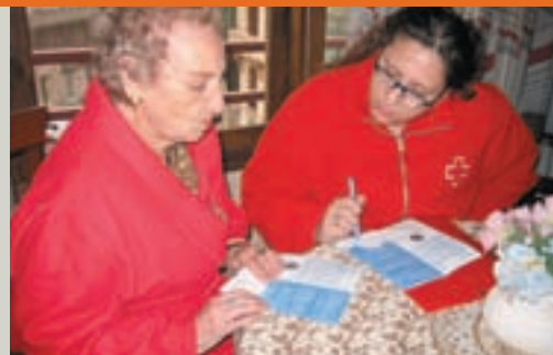
Los voluntarios explican cómo acondicionar su casa ante las olas de frío y de calor.