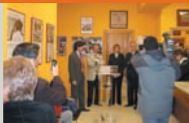
Autoridades y voluntarios de Cruz Roja asisten a la inauguración del local.