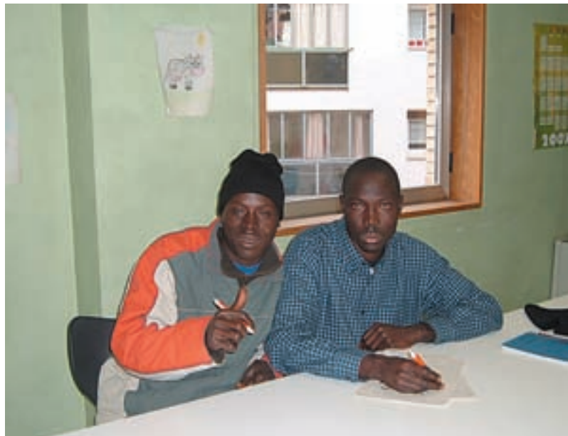
Inmigrantes llegados a Navarra.

Fomenta el establecimiento de relaciones sociales con el objetivo de crear grupos de autoayuda entre los participantes. Además el “Taller de Adaptación al Cambio” pretende dotar de estrategias de afrontamiento adecuadas que les ayuden a adaptarse a su nueva vida y colaborar en el desarrollo de una identidad más rica, a través del trabajo de la autoestima.