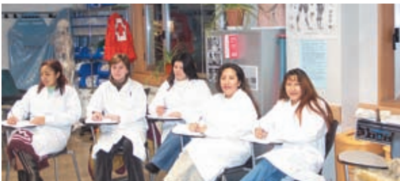
Participantes de los cursos de atención geriátrica.

Como novedad cabe destacar que este Taller experimenta nuevos servicios para personas mayores, como es el Aula Diurna, dirigida a personas dependientes, que se desarrolla en las propias instalaciones de Cruz Roja. A través de esta iniciativa se potencia además el autoempleo de las alumnas en una disciplina que, debido a la alta esperanza y al consiguiente envejecimiento de la población, cuenta