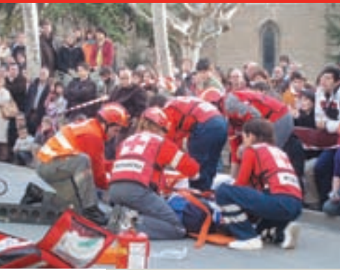
Simulacro de rescate de accidente llevado a cabo en Sangüesa.