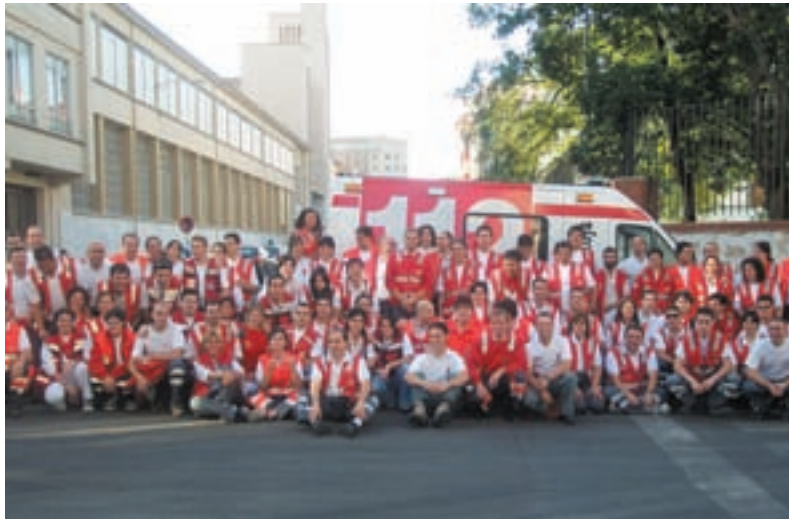
El voluntariado, la fuerza de la humanidad.