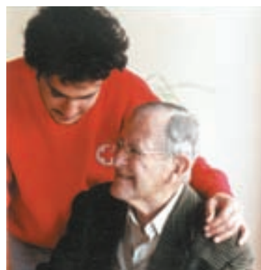
Cruz Roja cerca de las personas dependientes.

Cruz Roja ofrece, además, otra herramienta útil para cuidadores de personas dependientes como es la web www.sercuidador.org .