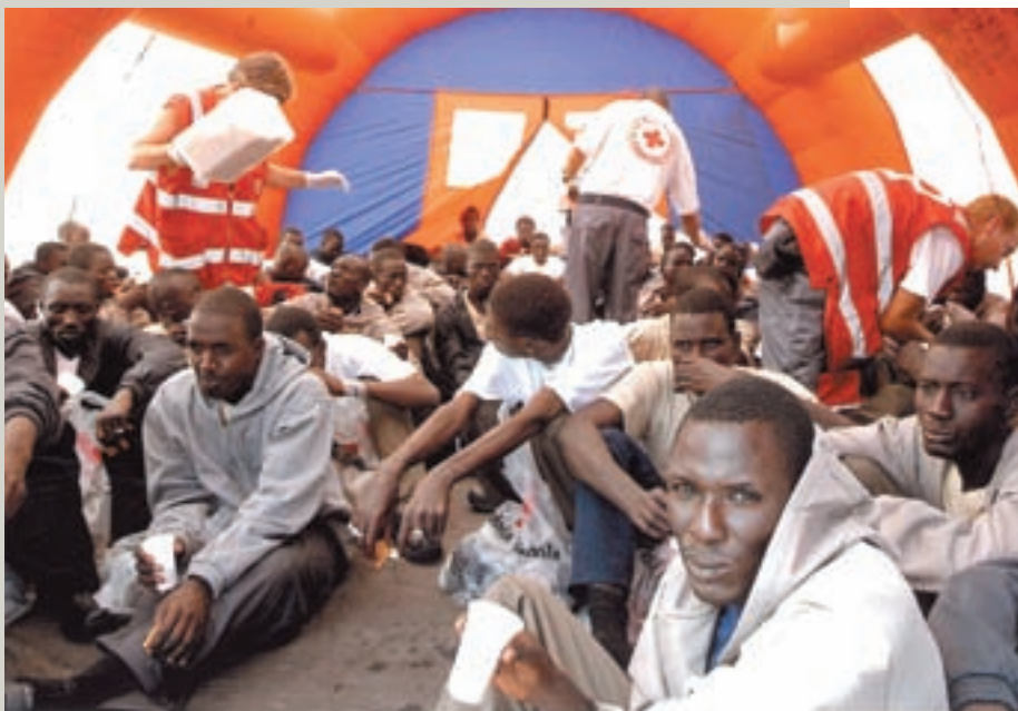
Voluntarios atienden a los subsaharianos llegados a Canarias.

En su devenir pesa la orden de repatriación. Un día volverán a su rincón africano donde les esperan los suyos. Su maleta de vuelta irá cargada... o vacía, de aquellos sueños que les impulsaron a jugarse la vida en cayucos y pateras. Recordarán que, por lo menos en Canarias, en Madrid y en Navarra la Cruz Roja les ayudó. Y recordarán que, en un mes de enero vieron "por primera vez" nevar en Pamplona; y nevaba igual para todos.