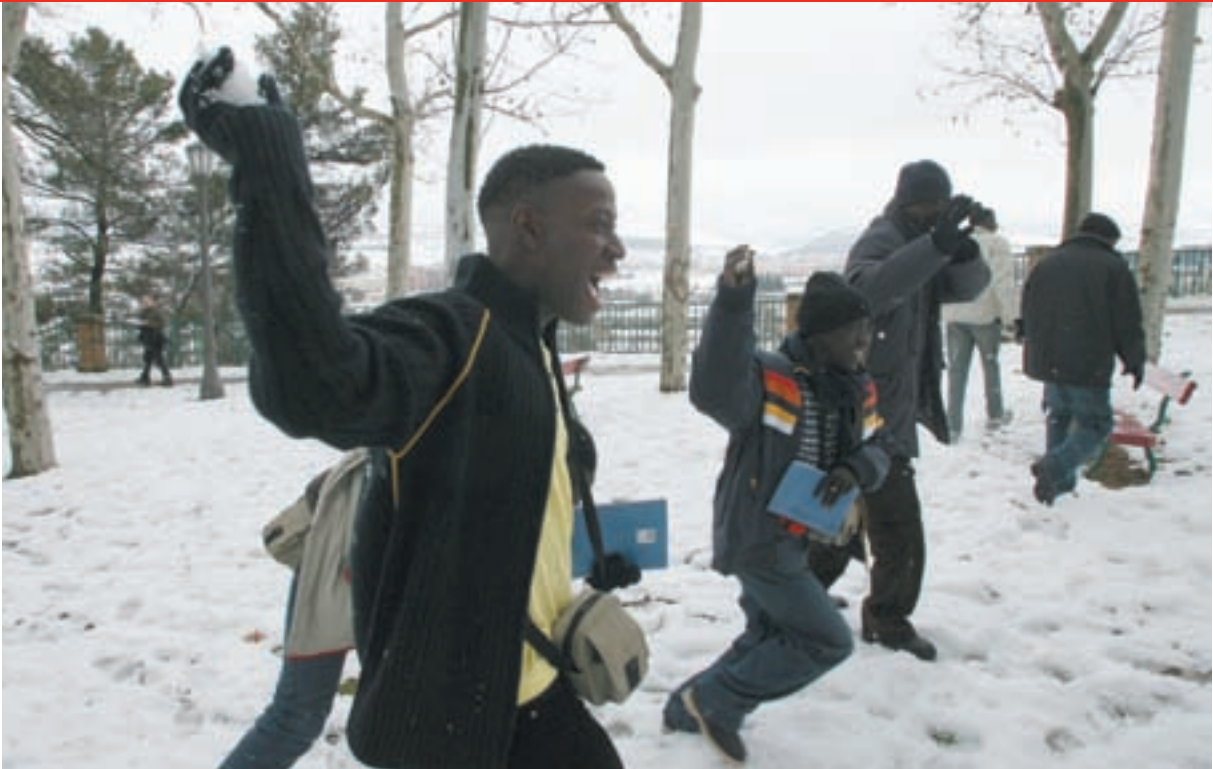
Los subsaharianos llegados en enero a Navarra vieron nevar "por primera vez".