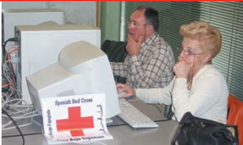
Los mayores también en la red.

Con proyectos como éste, Cruz Roja quiere fomentar el protagonismo social y público que corresponde a las personas mayores, en función de su peso demográfico y de la importancia que tiene su contribución al avance social. Y buena forma de hacerlo es plasmar en papel escrito sus vivencias y sentimientos. Así lo persigue el programa "Ahora- Orain: Poetas Solidarios" que edita una revista con creaciones literarias de personas mayores, especialmente.