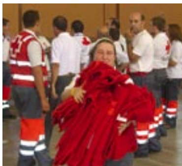
Voluntarios/as en el ERIE de albergue provisional por el incendio de agosto.

El trabajo de Cruz Roja ha consistido en proporcionar alojamiento a la población civil afectada y dar apoyo logístico a los miembros de la Unidad Militar de Emergencia. Además de activar el ERIE de albergue provisional a raíz de las inundaciones de octubre, Cruz Roja realizó numerosas evacuaciones y rescates de personas, y entregó kits estandarizados de ayuda de emer-