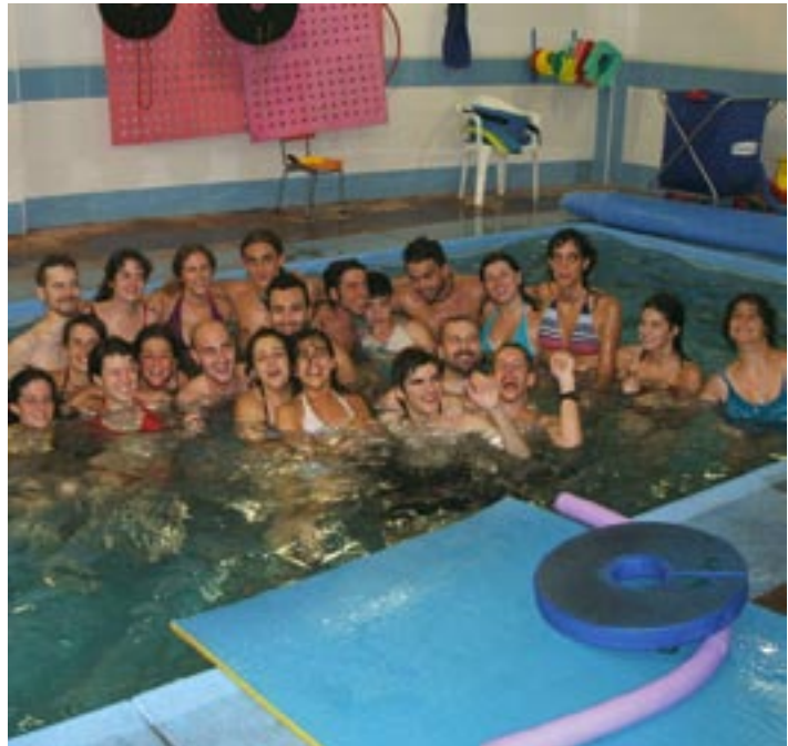
Las personas con parálisis cerebral participan en proyectos de ocio y deporte.

Gandía se mueve para financiar un proyecto de ayuda humanitaria de Cruz Roja para las personas afectadas por el mal de Chagas en los municipios de Aiquile, Omareque y Pasorapa (Cochabamba), Bolivia. El 13 de octubre el grupo boliviano "Los Kjarkas" dio un recital solidario para recaudar fondos. La acción cuenta con la colaboración de la Asociación de Bolivianos Residentes en la Safor y el Ayuntamiento de Gandía.