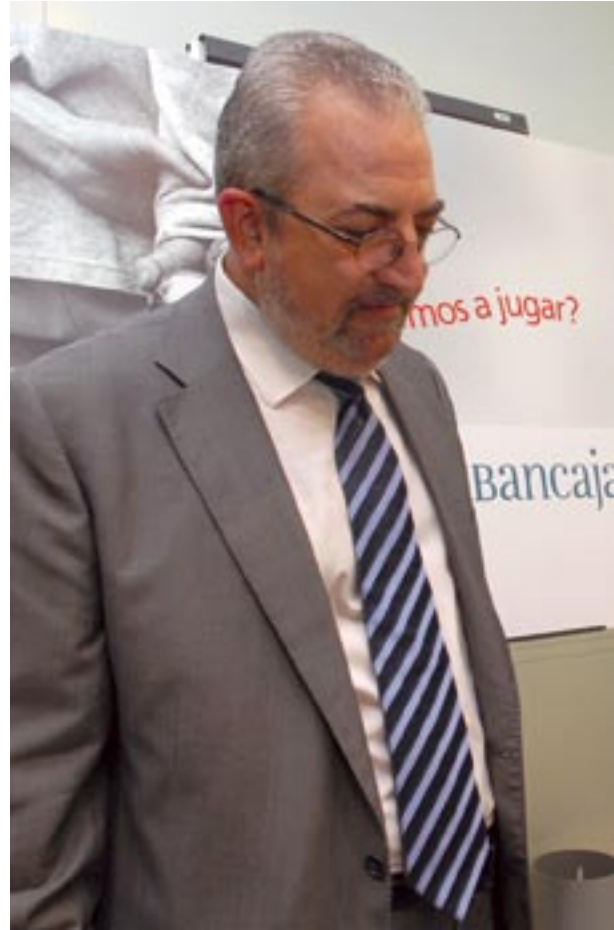
El director de Marketing de Bancaja y el presidente de Cruz Roja en la Comunidad Valenciana presentan el dispositivo.