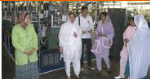
Visita de las alumnas a las instalaciones de la empresa Mari Claire, que ha colaborado en el proyecto.