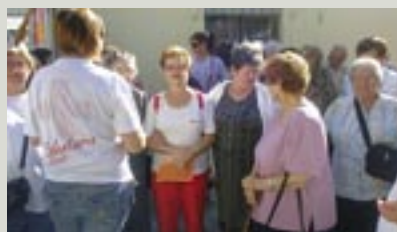
Momentos de convivencia entre los mayores.

El voluntariado, además de los socios y socias, supone un pilar fundamental para Cruz Roja Española. Por ello, la Asamblea Provincial de Cruz Roja en Alicante, ha puesto en marcha una campaña de Captación y Sensibilización del Voluntariado para incentivar a la población a que “dé la cara por los vulnerables”. Y es que, si te sobra tiempo, tienes mucho que dar.