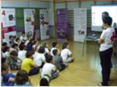
Voluntarios de Cruz Roja dan una charla a alumnos del IES El Grau.