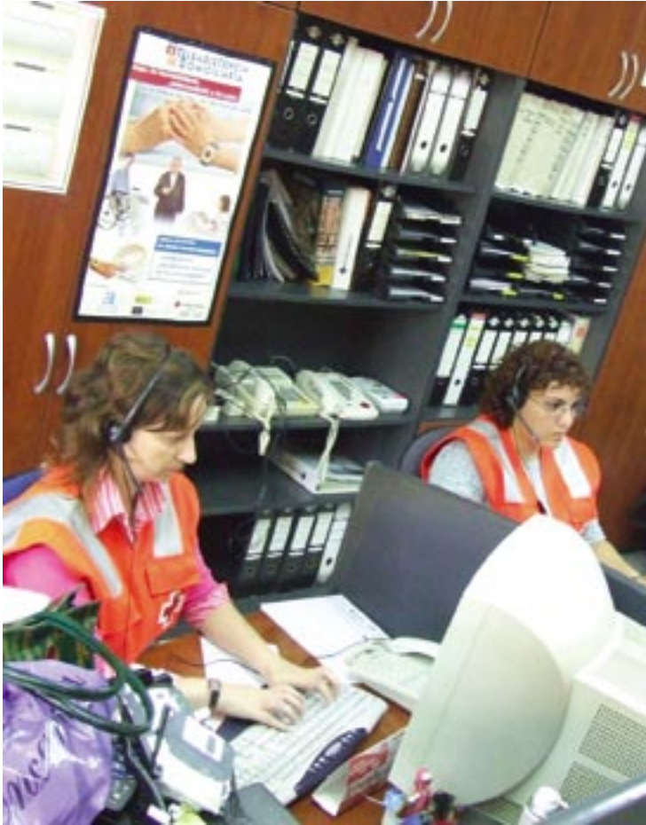
El Centro de Atención tiene permanentemente localizadas a los portadores del dispositivo.