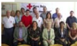
Los presidentes de las 19 asambleas locales de Cruz Roja en Castellón han tomado posesión de su cargo recientemente. El nuevo equipo trazará los grandes objetivos de

la ONG durante los próximos cuatro años, es gente solidaria, con una media de 6 años de voluntariado en la Institución. Hay 9 mujeres y 10 hombres. Encabezan las presidencias locales: empresarios, farmacéuticos, profesores, amas de casa, veterinarios, empleados de banca; jubilados, administrativos, funcionarios, ATS.