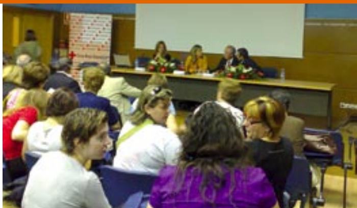
En la inauguración del foro se resaltó la contribución del cuidador.