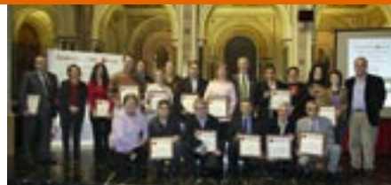
Reconocimiento a personas y entidades por su contribución a la Ayuda Humanitaria.

Para realizar esta importante labor al servicio de los ciudadanos, Cruz Roja se ha coordinado en todo momento con la Conselleria de Governació. Ambas entidades han firmado un acuerdo este año que mejora los niveles de coordinación en las playas valencianas y dotará a la Institución Humanitaria de tres ERIE de apoyo psicosocial, un ERIE de asistencia sanitaria y clasificación de víctimas y dos ERIE de albergue provisional.