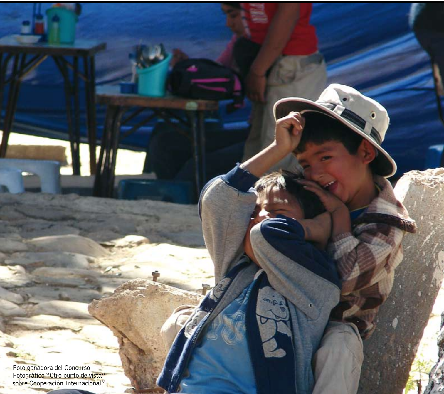
Foto ganadora del Concurso Fotográfico "Otro punto de vista" sobre Cooperación Internacional".