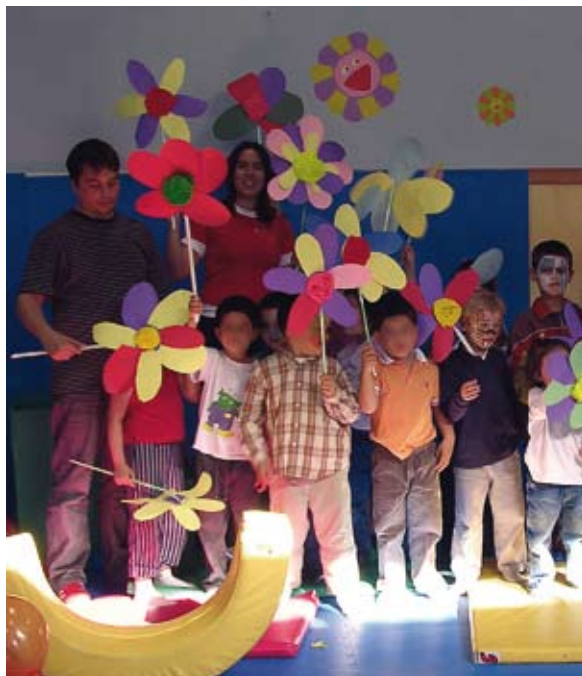
Voluntarios en actividades y talleres con niños en la Ludoteca de Cruz Roja en Toledo.