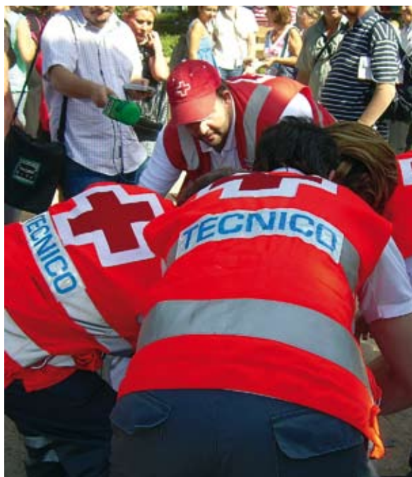
Voluntarios del programa de socorros y emergencias asistiendo a una señora desmayada por la "Ola de Calor".