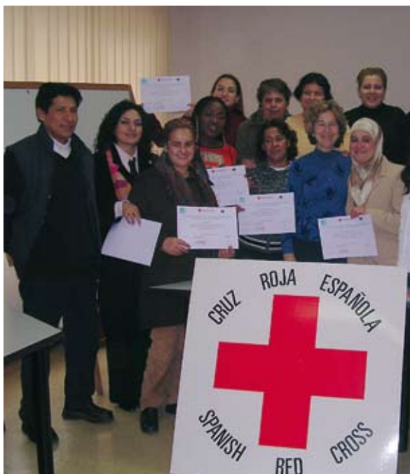
Asistentes del curso de empleo para inmigrantes con la presidenta de la Asamblea Local de Toledo, Esperanza Correa.