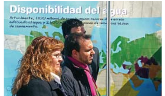
Foto cartel campaña y foto jóvenes Cruz Roja Juventud.