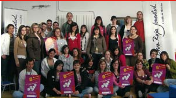
Grupo de voluntarios de Cruz Roja Juventud, que participaron de la campaña "Trabaja por la Igualdad" celebrada con motivo del día de la mujer.