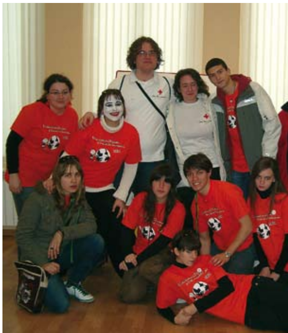
Grupo de voluntarios de Albacete que participaron de las actividades en el día de la mujer trabajadora.