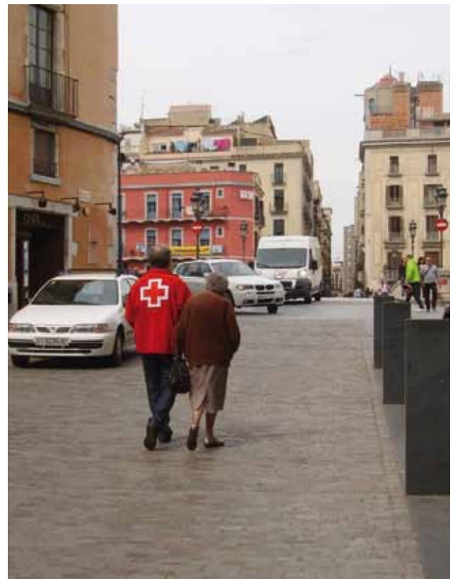
Moment de la gravació del curtmetratge de l'escola ERAM.

Tallers per aprendre a fer servir el mòbil, ordinadors, etc., per tal de donar eines i estratègies per afavorir l'aprenentatge de temes del seu interès.