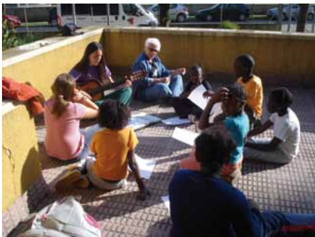
Centre de mediació a La Garrotxa.

CRJ compta amb 2 espais d'intervenció social adreçats a nens i nenes amb dificultats d'integració social que ofereixen activitats lúdiques i formatives: un a La Garrotxa i un a Palafrugell.