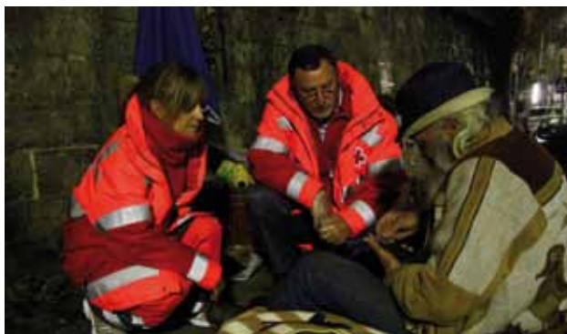
Dispositiu Onada de fred a Girona.

El dispositiu va constar d'una unitat de coordinació i una unitat de transport amb voluntaris de la nostra institució, equipats amb termos pel subministre de begudes i roba d'abric (mantes) per atendre les necessitats dels sense sostre. Tres unitats portaven també material sanitari per realitzar una assistència sanitària bàsica completa en cas de necessitat. En aquest dispositiu també es recullen les dades personals dels sense sostre perquè, si ho desitgen i hi ha disponibilitat, se'ls pugui acollir al Centre Social La Sopa, alhora que són enviades als serveis socials municipals per tal que en facin seguiment. Un total de 95 persones es van acollir a aquest dispositiu.