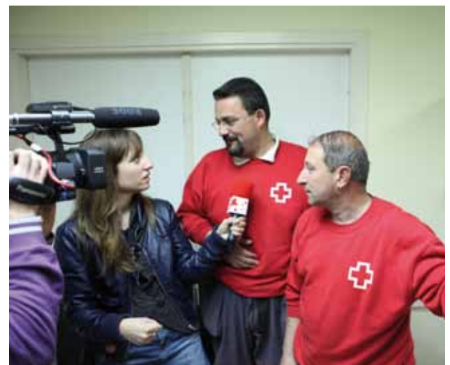
Imatges del Rodatge de l'anunci del Sorteig d'Or de Creu Roja en els projectes socials de Creu Roja a Palamós