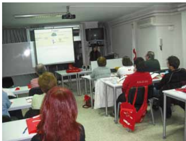
Formació als voluntaris i voluntàries del "Movent-nos per l'estalvi domèstic" a Girona.

Una altra activitat destacada i que ha tingut molt bona acollida ha estat la creació i dinamització de 4 contes i un CD amb els contes narrats per treballar amb la població infantil els animals ferotges en perill d'extinció a Catalunya.