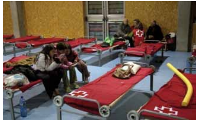
Alberg provisional a Lloret de Mar, gestionat per Creu Roja a Blanes-Lloret-Tossa.

Des del primer moment l'Assemblea Local de la Creu Roja a Girona es va coordinar amb la Policia Local de la capital gironina, per tal de donar suport a la població amb problemes a la via pública, i va desplaçar 2 coordinadors al centre de coordinació de la policia local.