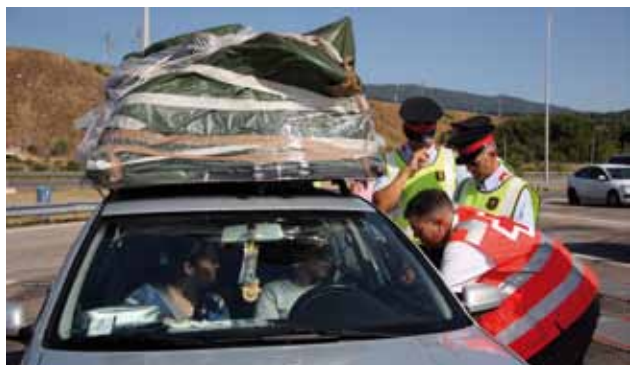
Intèrpret de la Creu Roja explicant el dispositiu

En els controls de trànsit es reparteixen tríptics en francès i àrab, a banda de fer-ho en català i castellà, amb consells sobre seguretat viària abans d'iniciar el viatge i un cop s'és a la carretera.