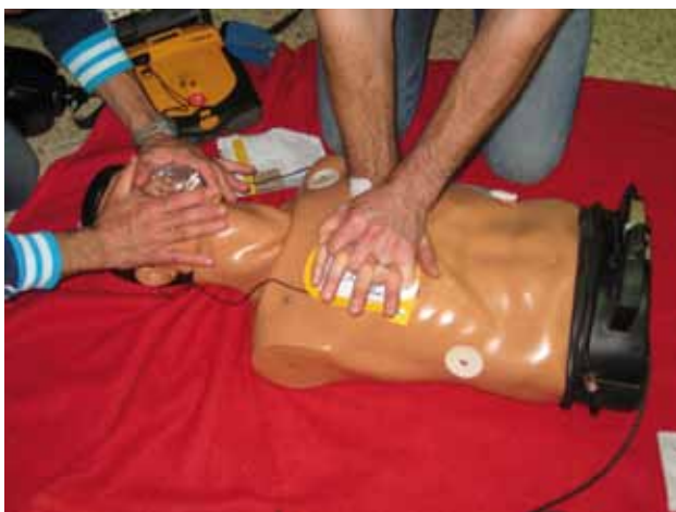
Fotografia de pràctiques en un curs de DEA.

L'any 2010 es van dur a terme 46 cursos de Desfibril·lador Extern Automàtic, formant un total de 362 persones i un total de 58 cursos de reciclatge per a 310 persones que ja disposaven del carnet per a l'ús del Desfibril·lador.