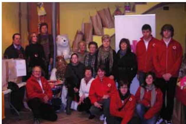
Voluntaris i voluntàries de la campanya de juguines desenvolupada a l'Assemblea local de Sant Feliu de Guíxols–Vall d'Aro.

La campanya actual ha mobilitzat a 219 persones voluntàries en 12 assemblees locals i comarcals de la Creu Roja a les comarques Gironines: Assemblea local d'Arbúcies, Assemblea local de Blanes–Lloret de Mar–Tossa de Mar, Assemblea local de Figueres, Assemblea local de Girona, Assemblea Comarcal de La Garrotxa, Assemblea local de Llançà, Assemblea local de Palafrugell, Assemblea local de Roses–Castelló d'Empúries, Assemblea local de Sant Feliu de Guíxols–Vall d'Aro, Assemblea local de Santa Coloma de Farners, Assemblea local de Torroella de Montgrí, Assemblea local de la Vall de Camprodon.