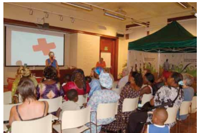
Santa Coloma de Farners

Aquesta primera fase es va finalitzar a Santa Coloma de Farners , al mes de juliol, a la Biblioteca Municipal, on a la inauguració hi van participar un nodrit grup de dones subsaharianes, que van preparar menjars i begudes de la seva cultura. Al voltant de 100 persones la van visitar en aquest punt.