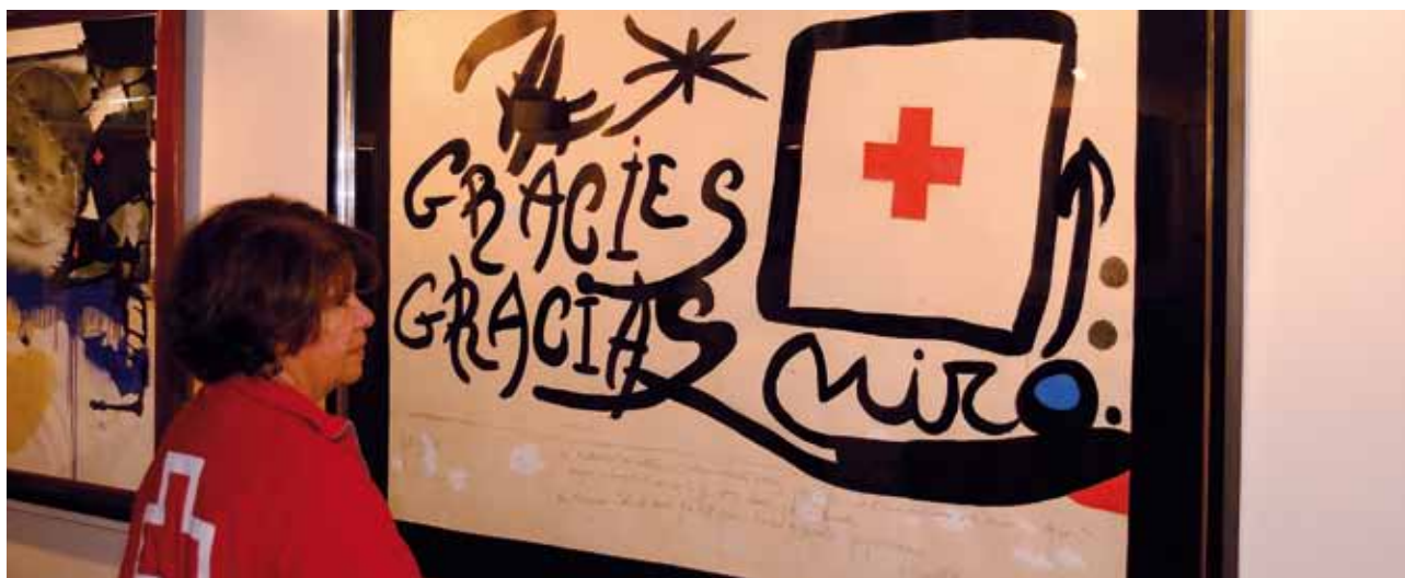
Exposició del fons d'art de Creu Roja Catalunya a Girona.