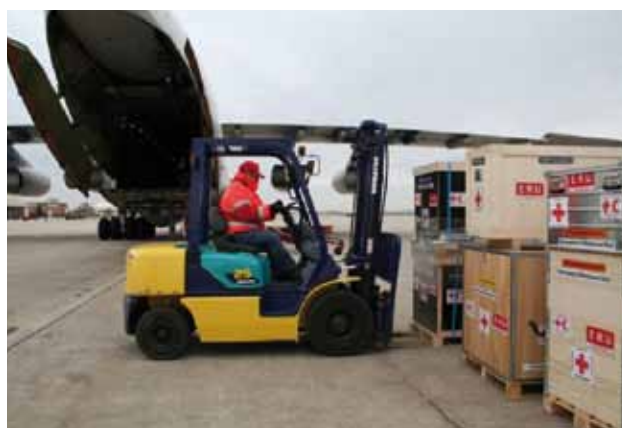
Enviament d'ajuda humanitària a Haití

A més es van efectuar aportacions pels damnificats del Tifó Ketsana al Vietnam per valor de 2500 euros , aportats per l'Ajuntament de Castell-Platja d'Aro i els damnificats per les greus inundacions al Pakistan per valor de 4.700 euros , dels quals 3000 euros corresponen a aportacions de l'Ajuntament de Palafrugell . La resta correspon a aportacions de particulars