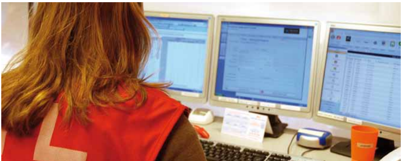
Operadora Central programa de teleassistència mòbil per a víctimes de violència de gènere (tamvg)

I per últim, destacar també l'actuació de Creu Roja Girona dins la Taula de Prostitució, creada per donar resposta a aquest fenomen a les comarques gironines. En ella hi participen entitats privades i organismes públics que es reuneixen trimestralment. Durant l'any 2010 s'ha estat creant un mapa de recursos de la zona, on figuren totes les entitats i associacions presents a la taula i la tasca que fan cadascuna d'elles, i s'han anat exposant els problemes amb els quals es troben les entitats en referència a aquest col·lectiu (problemes d'empadronament, sanitaris, etc.). També s'ha previst una formació pel 2011 dirigida a professionals de l'àmbit social, sanitari, immigració, etc. per donar a conèixer recursos, context, marc legal, etc.