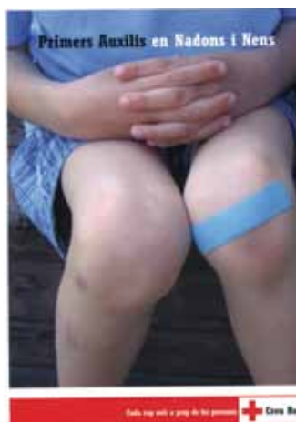
Fotografia del Manual de primers auxilis en nadons i nens.

Cada cop més es realitzen cursos de Primers Auxilis aplicats a diferents entorns i col·lectius. A més es disposa de nous manuals específics com són: Primers auxilis en nadons i nens, a la llar, a la natura, per la gent gran, l'esport i l'entorn laboral. Aquests cursos tenen com a objectiu aprendre a prevenir accidents, aplicar els procediments i les tècniques més adequades en autoprotecció i suport a l'assistència sanitària i identificar i resoldre situacions d'urgència vital.