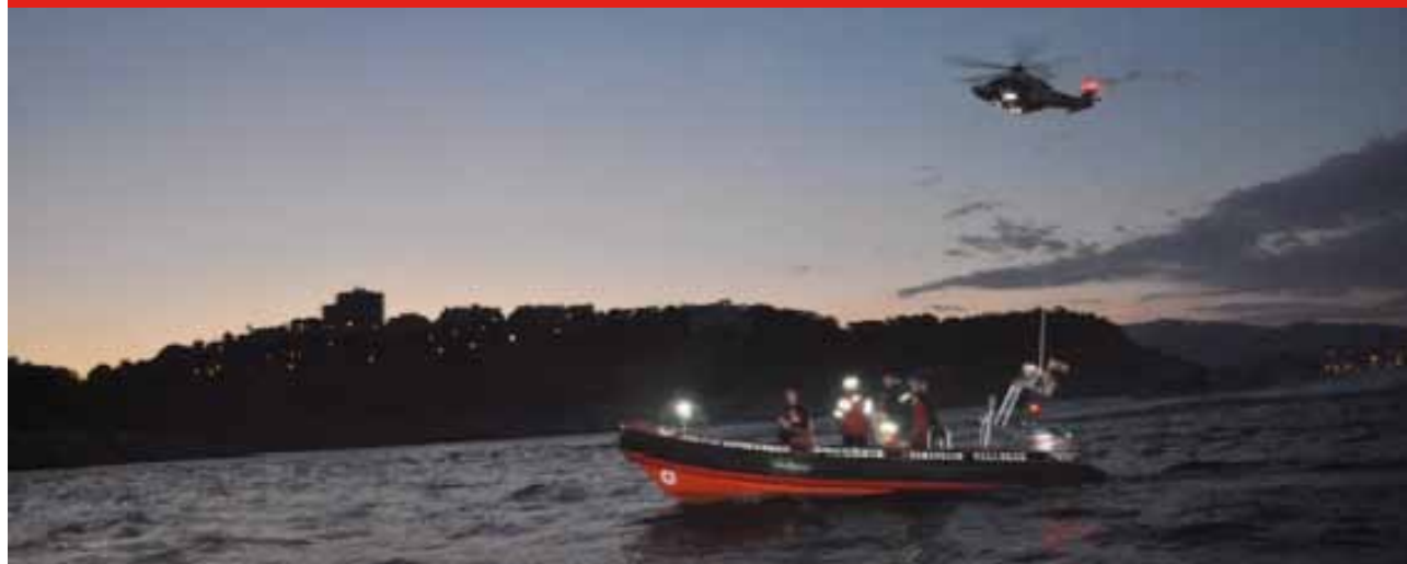
Pràctiques de Creu Roja Sant Feliu de Guíxols–Vall d'Aro en salvament marítim.

Destaquem també les col·laboracions amb Salvament Marítim per assistències a embarcacions en situacions de risc que han estat portades a terme essencialment per les assemblees de Blanes-Lloret de Mar-Tossa de Mar i Sant Feliu de Guíxols .