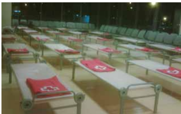
Alberg provisional a les instal·lacions de l'Aeroport de Girona-Costa Brava.

Aquest acord de col·laboració també es va activar amb motiu de la vaga de controladors on Creu Roja a Figueres va tenir disponibles 25 llits en cas que haguessin estat necessaris a l'aeroport.