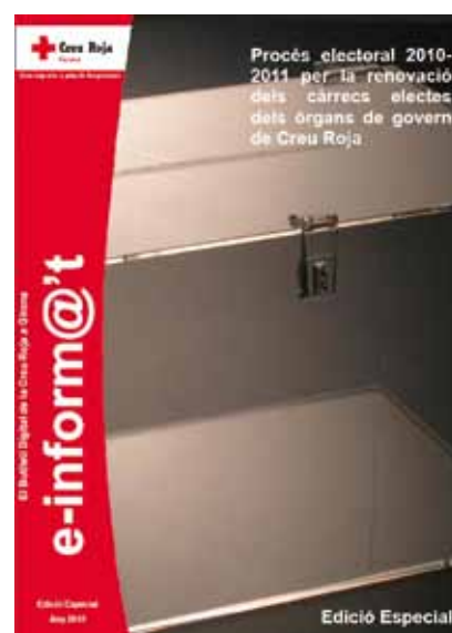
Edició especial procés electoral.