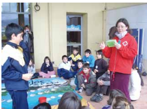
Activitat del gran joc de l'aigua a Olot

La tipologia dels projectes de caràcter mediambiental que es desenvolupen a la província és diversa, va des de projectes d'educació ambiental amb infants i joves, fins a projectes d'intervenció directa al terreny i passant per diferents campanyes de sensibilització. Enguany podem destacar la creació d'un nou recurs anomenat "Movent-nos per l'aigua" l'objectiu del qual és sensibilitzar a nens i nenes de la importància de l'aigua com a font de vida al nostre planeta, element bàsic per a l'existència de tots els éssers que hi vivim. Consta de dos recursos educatius adaptats per edats: un conte gegant del "viatge d'una gota", destinat a nens i nenes de 6 a 9 anys i 1 joc de gran format "el gran joc de l'aigua" destinat a nens i nenes de 9 a 12 anys.