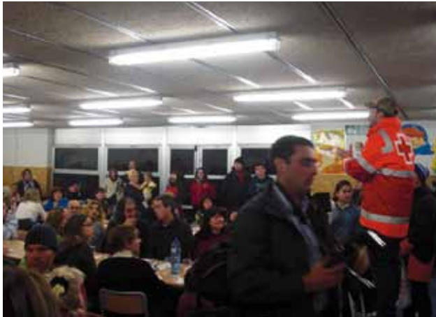
Alberg provisional al pavelló de Lloret de Mar.

Arran de les fortes nevades ocorregudes el passat mes de març, la Creu Roja va mobilitzar a un total de 250 voluntaris i voluntàries per tal de donar cobertura a la fase d'emergència del Pla NEUCAT., alhora que es mantenia també activat, per la Direcció General de Protecció Civil, el Pla de Protecció Civil de Catalunya (Proccat) per l'estat de la mar, del vent i risc d'allaus.