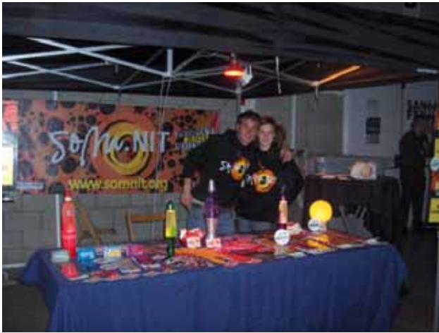
Activitat del SOM.NIT a la Bisbal d'Empordà.

ha 62 voluntaris/àries formats de la província de Girona que han fet arribar el projecte a gairebé 4000 joves que estaven de festa.