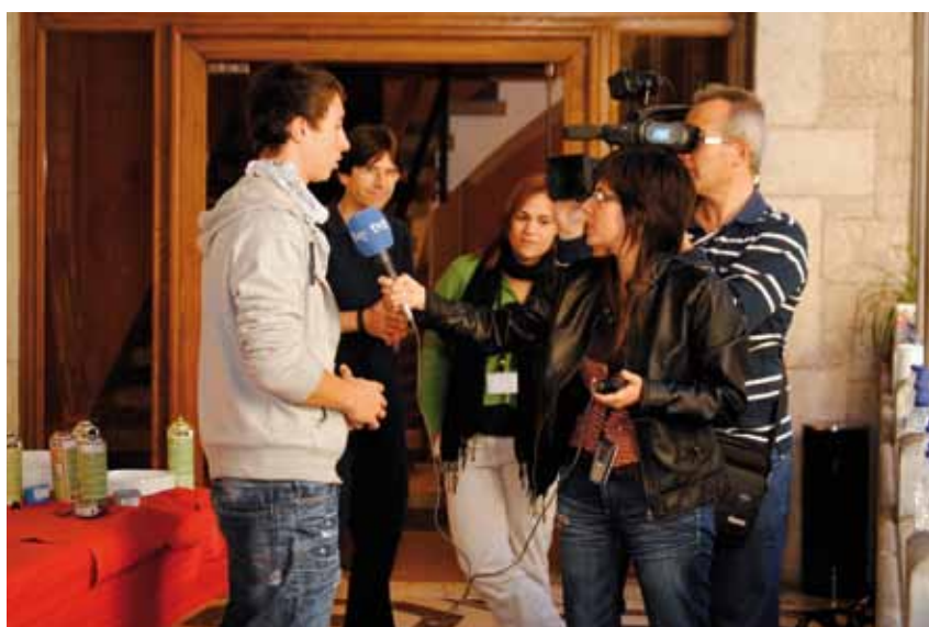
Jornades dones al Segle XXI.