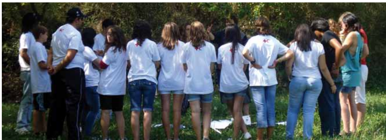
Trobada Provincial de voluntaris i voluntàries de Creu Roja Joventut.