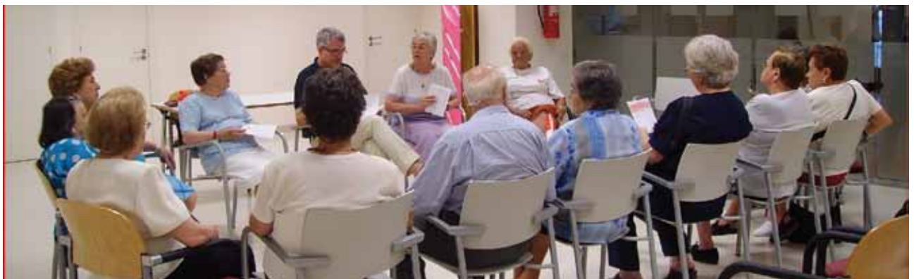
Un dels tallers realitzats amb gent gran.