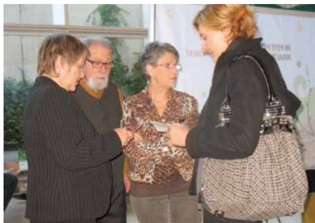
Activitat Escola Annexa