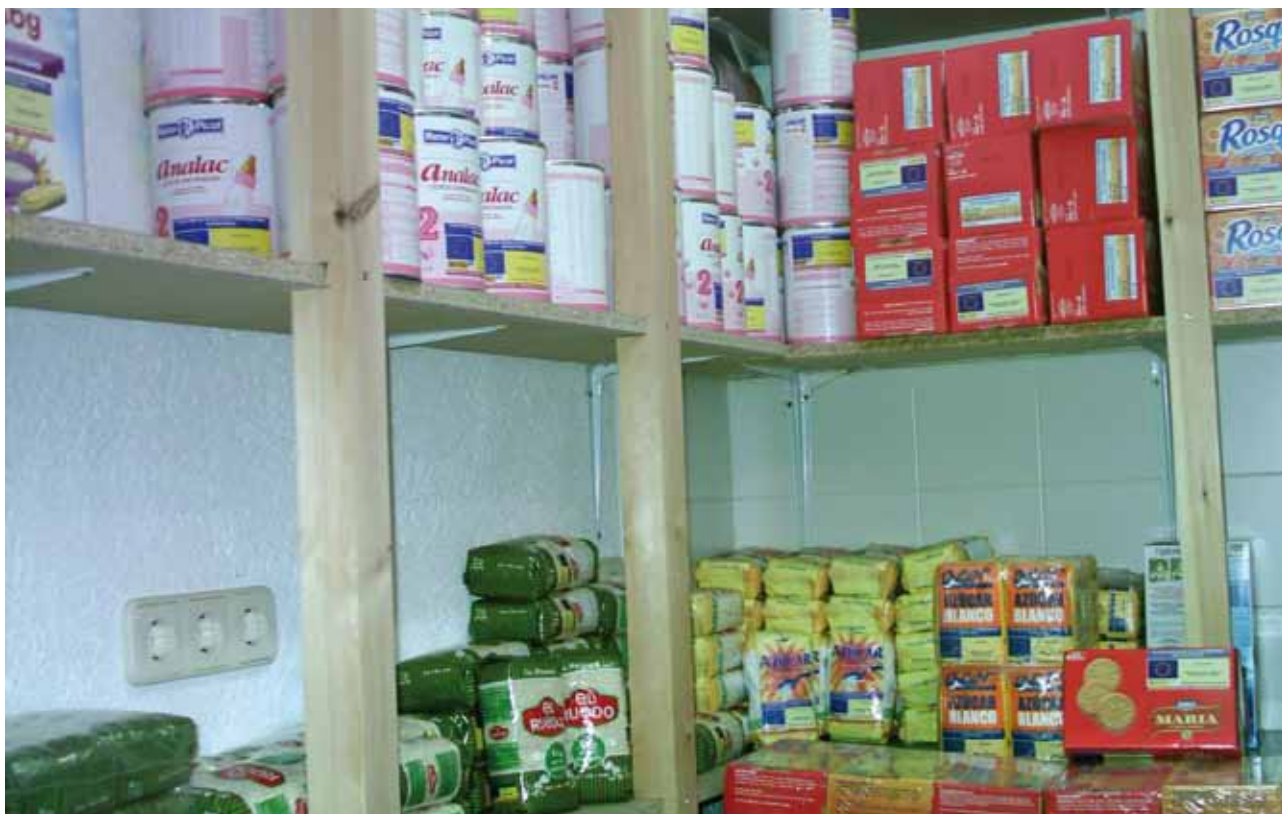
Magatzem d'aliments que la Creu Roja té a Arbúcies i gestiona en col·laboració amb l'Ajuntament de la vila.

bàsiques de nadons (higiènic i alimentació) i família (alimentació).