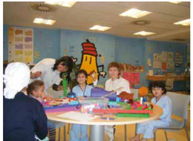
Taller de Sant Jordi a la ciberaula de l'hospital Dr. Josep Trueta de Girona.