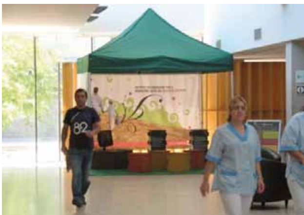
IAS. Hospital Santa Cartarina

A Girona capital, l'exposició va ser presentada per les Fires i Festes de Sant Narcís, a la Facultat de Dret de la Universitat de Girona, del 25 d'octubre al 5 de novembre. Aquest projecte de sensibilització a la ciutat, va rebre una subvenció de l'Ajuntament de Girona de 1198,89 euros. Durant la seva permanència a la Universitat la van visitar al voltant de 150 persones.