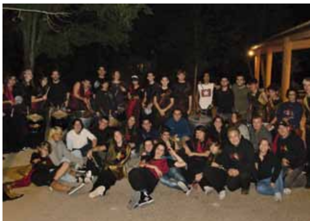
Moment de la XI Trobada Provincial de CRJ a les comarques Gironines amb la batucada que ens va oferir el grup de percussió Xirois de Santa Eugènia.

Es va celebrar a la Casa de colònies Can Sans de Fellines, a Viladesens, els dies 22, 23 i 24 d'octubre de 2010. En total han participat d'aquesta activitat 35 voluntaris i voluntàries de diferents assemblees del territori.