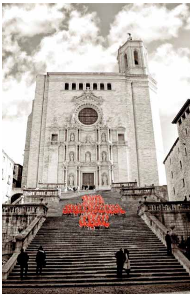
Sessió de fotos (5 de desembre de 2010).

Un dels objectius de l'àmbit de voluntariat és augmentar el cens actual de voluntaris i voluntàries a través de campanyes de captació; és per aquest motiu que aquest any 2010 s'han dissenyat clauers i calendaris per a realitzar aquestes campanyes i d'aquesta manera poder sensibilitzar la població sobre la tasca de la Institució i aconseguir així més voluntariat.