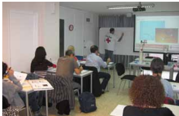
Fotografia d'un curs de formació ocupacional a Girona

L'any 2010 la Creu Roja a Girona van portar a terme cursos de formació ocupacional, dins la convocatòria per a la realització d'accions de formació d'oferta mitjançant plans formatius en àrees professionals prioritàries, subvencionats pel Servei d'Ocupació de Catalunya i el Fons Social Europeu.