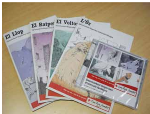
Mostra dels contes i CD creats.

En el grup de voluntariat ambiental hi ha participat un total de 85 joves de diferents localitats. S'ha arribat a 680 persones a través d'aquests projectes d'educació i sensibilització ambiental.