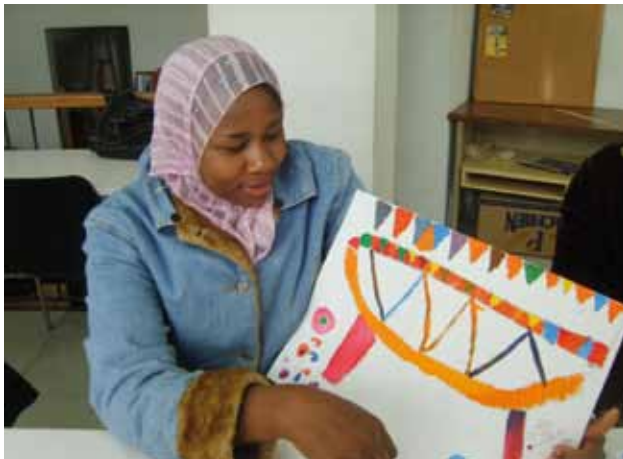
Participant Taller Tolerància Zero