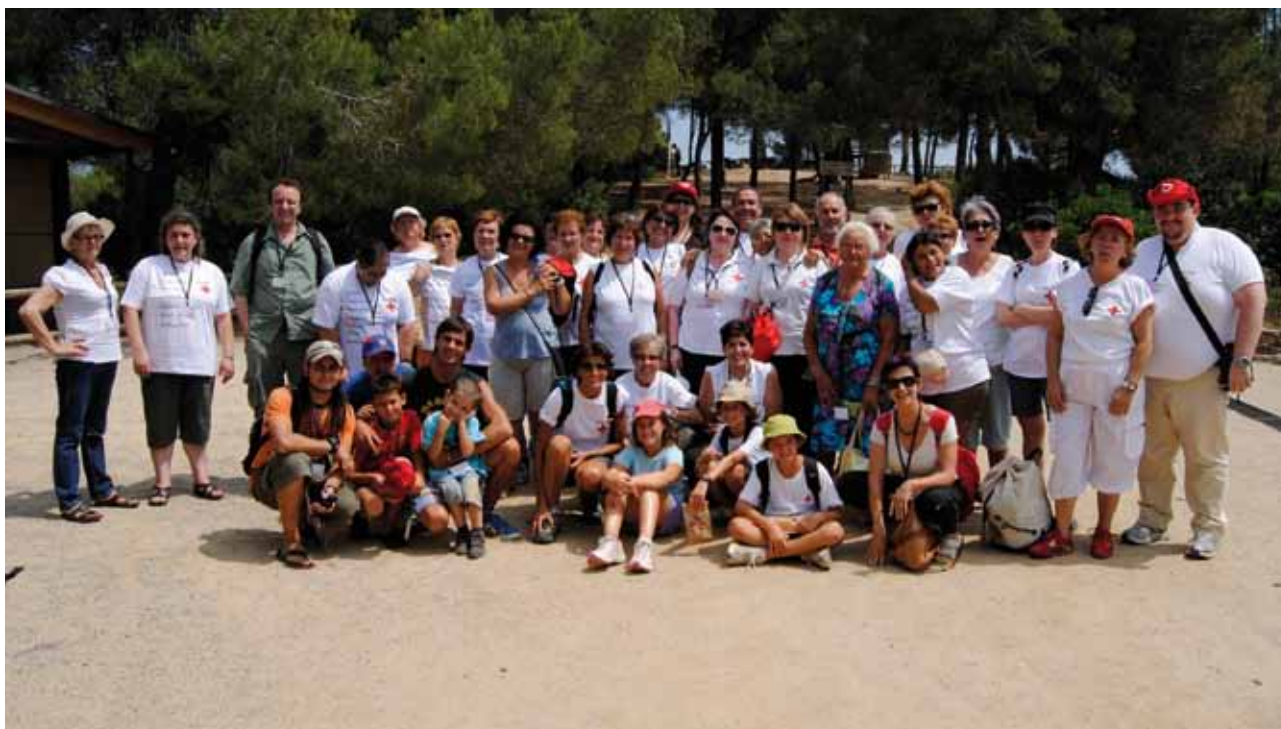
Sortida a El Cim d'Àligues (juliol 2010)

Com a activitats de vida associativa, aquest any 2010 se n'han realitzat un total de 87 activitats amb una participació de 1.236 voluntaris i voluntàries. De totes les activitats realitzades, destaquem la sortida a El Cim d'Àligues el mes de juliol, la sessió de fotos realitzada el 5 de desembre, amb motiu del Dia Internacional del voluntariat a Girona, i destacar també la nostra participació al Congrés Estatal de Voluntariat "Racimos de la Humanidad" a La Rioja.