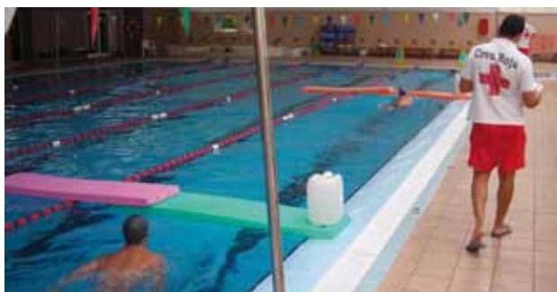
Fotografia d'un curs de Socorrisme Aquàtic.

Aquesta formació suposa una especialització dels coneixements dels primers auxilis aplicats en el medi aquàtic. S'aprenen les tècniques bàsiques per socórrer una víctima a través d'una formació teòrica i pràctica en piscina. La durada dels cursos és de 50 hores i s'ha de tenir el títol d'Atenció sanitària immediata nivell II.