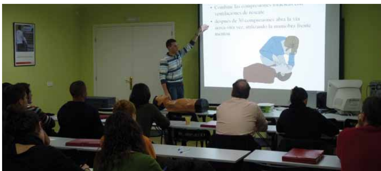
Curs de socorrisme a Sant Feliu de Guíxols.