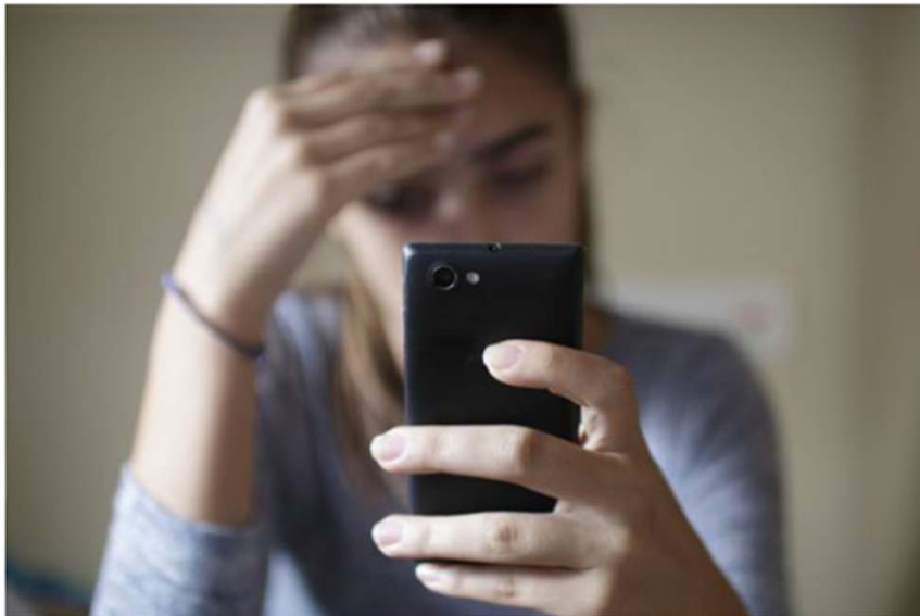
Una adolescente cabizbaja tras recibir una amenaza a través de su móvil.

Archivado en: Acoso escolar Violencia escolar Integridad personal Madrid Comunidad de Madrid España Educación Delitos Justicia Problemas sociales Sociedad